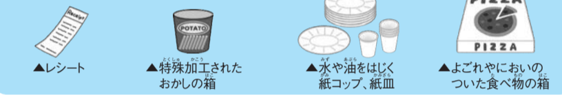
図 資源循環課 計画係 ☎ 436-2433