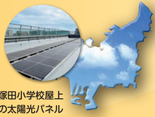
塚田小学校屋上の太陽光パネル