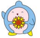
▲船橋市ゼロカーボンシティ推進地域協議会キャラクター「ふなわりくん」

船橋市では、2050年までに二酸化炭素排出量を実質ゼロにする「ゼロカーボン」を目標に、さまざまな地球温暖化対策の取り組みを進めているよ。みんなも「ゼロカーボン」にチャレンジしてね！