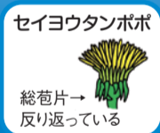
セイヨウタンポポ 総苞片→ 反り返っている