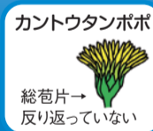
カントウタンポポ 総苞片→ 反り返っていない