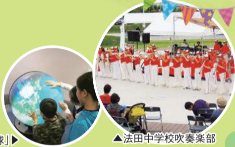
▲法田中学校吹奏楽部

1、2日は学習館のオープンおよび市制施行80周年を記念してイベントを開催。法田中学校吹奏楽部の演奏や市立船橋高校吹奏楽部のパフォーマンス、サイエンスショー、貝がらを使った工作など、たくさんのイベントやワークショップが行われ、大変賑わいました。