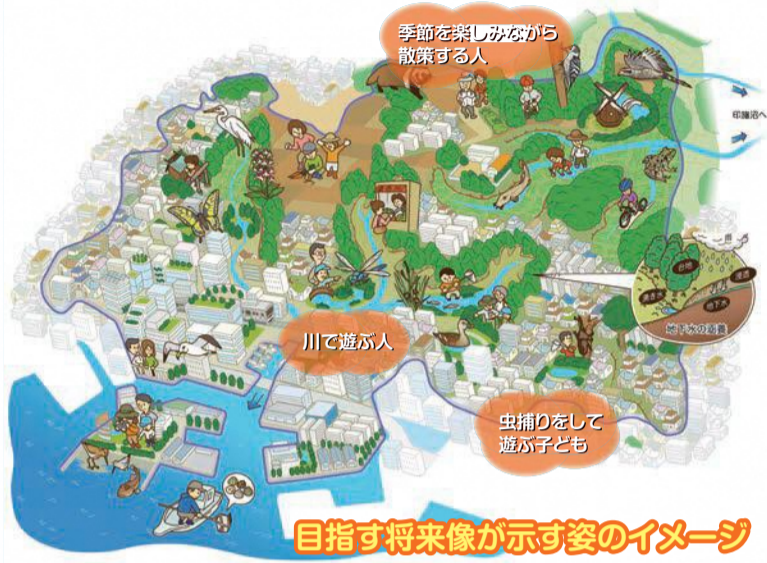
目指す将来像が示す姿のイメージ