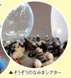
▲そうぞうのなみまシアター