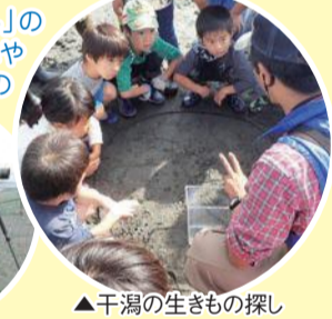
▲干潟の生きもの探し