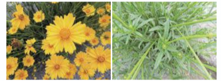
花びらの先端に4～5つのギザギザがある