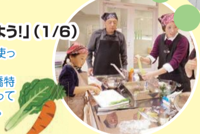
▲学習館と噴水広場

家族で参加できる、船橋の食材を使った地産地消の料理教室。1月は、一年の無病息災を願い、船橋特産の野菜や浜辺の食用植物を使ってオリジナルの七草がゆを作りました。