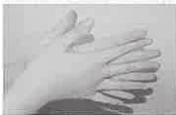
1. 手のひらを含ませ、よく洗う