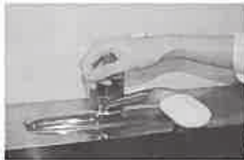
7. 水道の栓を止めるときは、手首が肘で止める。できないときは、ペーパータオルを使用して止める