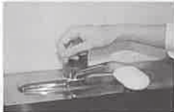
7. 水道の栓を止めるときは、手首が肘で止める。できないときは、ペーパータオルを使用して止める