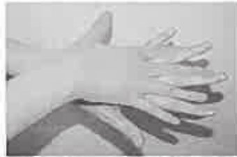
2. 手の甲を伸ばすように洗う