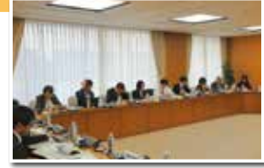
愛知県豊田市での視察の様子

大阪府寝屋川市では、人事・給与制度改革及び働き方改革について、兵庫県神戸市では、働き方改革(業務改革)について、愛知県豊田市では、投票環境の充実に向けた取組について、それぞれ説明を受け、質疑を行いました。 10月31日、11月1日 視察 ・寝屋川市(人事・給与制度改革及び働き方改革について) ・神戸市(働き方改革(業務改革)について) ・豊田市(投票環境の充実に向けた取組について)