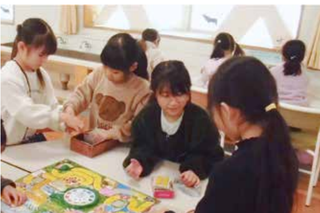
放課後子供教室の活動の様子

答 管理部長 現在子供たちの放課後の居場所として定着していることから、引き続き事業を継続したいと考えている。なお、将来的な事業展開に関しては、文部科学省の方針や他自治体の施策などを見極めながら、事業の実施内容の精査と充実に努めていく。