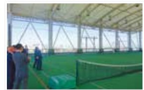
愛知県半田市での視察の様子

法人の経営状況報告について、参考人から説明を受け、質疑を行いました。愛知県半田市では、総合型地域スポーツクラブについて説明を受け、質疑を行いました。その後、NPO法人ソシオ成岩スポーツクラブを見学しました。大阪府堺市及び大阪府豊中市では、スポーツ振興基金及び総合型地域スポーツクラブについて説明を受け、質疑を行いました。 10月18日 会議 ・法人の経営状況報告について 10月26日、27日 視察 ・半田市(総合型地域スポーツクラブについて) ・堺市・豊中市(総合型地域スポーツクラブについて/スポーツ振興基金について)