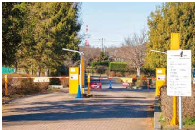
公共施設駐車場の障害者割引のデジタル化を