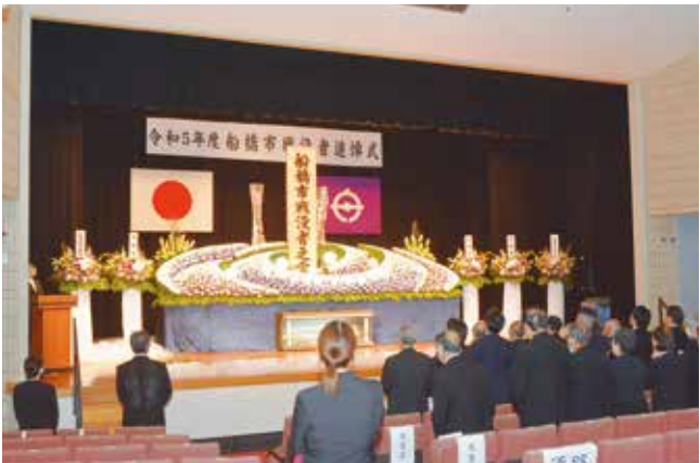
令和5年度船橋市戦没者追悼式の様子

戦没者に謹んで哀悼の誠をささげ、悲惨な戦争の歴史を繰り返さぬようご遺族の戦禍の記憶を共有し、またその労苦に対して深い敬意を表する機会として市としても重要なもの。船橋市遺族会のご意見も伺いながら検討を進めて参りたい。