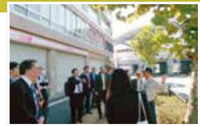
兵庫県西宮土木事務所での視察の様子

兵庫県芦屋市では、無電柱化の推進及び街路樹の管理について説明を受け、質疑を行い、その後、市道の街路樹等を視察しました。兵庫県(西宮土木事務所)では、街路樹の管理について説明を受け、質疑を行い、その後、県道の街路樹を視察しました。また、公益財団法人船橋市公園協会の職員を参考人として招致し、経営状況報告書について説明を受け、質疑を行いました。 10月31日、11月1日 視察 ・芦屋市(無電柱化の推進について/街路樹の管理について) ・兵庫県(西宮土木事務所)(街路樹の管理について) 11月7日 会議 ・法人の経営状況報告について(公益財団法人船橋市公園協会に関する事項) ・行政視察の振り返りについて