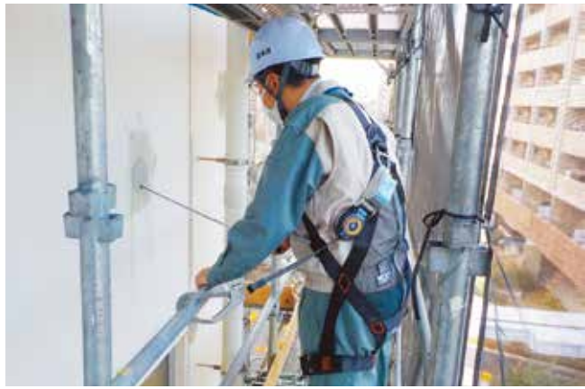
公共工事施工状況確認の様子

別に格付けし、発注工事の設計金額や技術難易度などを勘案し、施工能力に応じた入札参加ができるようにしている。