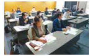
福岡県北九州市での視察の様子

福岡市では、未就園児の定期的な預かりモデル事業について、北九州市では、北九州市介護ロボット等導入支援・普及促進センターについて、奈良市では、奈良市子どもセンターについて、それぞれ説明を受け、質疑を行いました。また、北九州市と奈良市では、施設内の見学をしました。 いわゆる「ごみ屋敷」への対応について所管課から説明を受け、質疑を行いました。また、11月1日～2日の行政視察の振り返りを行いました。 11月1日、2日 視察 ・福岡市(未就園児の定期的な預かりモデル事業について) ・北九州市(北九州市介護ロボット等導入支援・普及促進センターについて) ・奈良市(奈良市子どもセンターについて) 11月8日 会議 ・いわゆる「ごみ屋敷」への対応について ・行政視察の振り返りについて