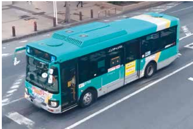
市内を走る路線バス