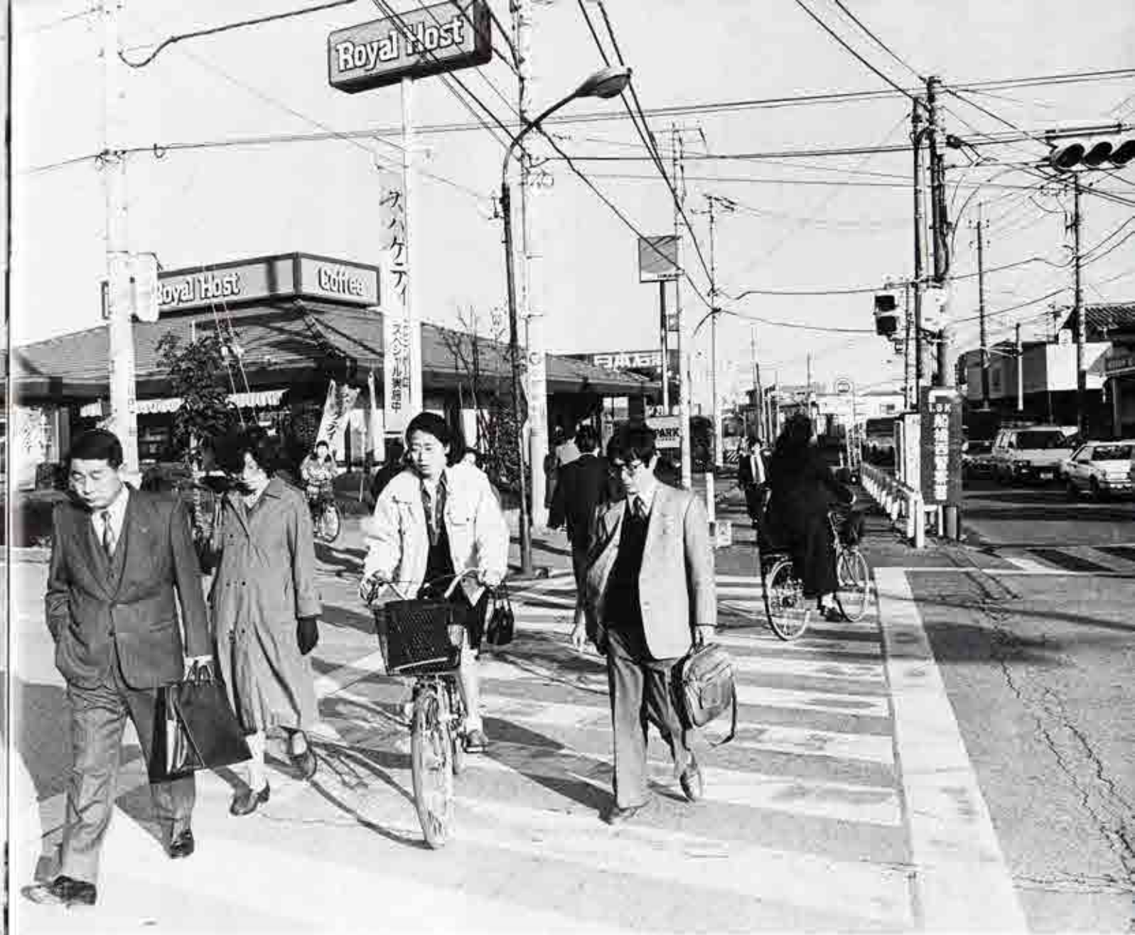
北口を背に400メートルほど進んだところにある天沼交差点。今この脇では、長津川の改修工事に伴い水道の移設工事が行われている。