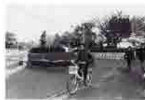
道行く人をやさしく見つめるブロンズ像「希望」(天沼弁天池公園)