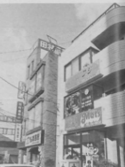
個性的な北口のビル