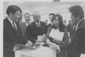
市民課の電算システムを視察する西安市の一行。

今年4月、友好交流促進合意書を締結、交流を深めている中国・西安市から、このほど経済貿易考察団、財政金融考察団が、10月11日、18日と相次いで船橋市を訪問、友好を深めました。また、これと前後して、船橋市から囲碁使節団一行30人が「シルクロード囲碁大会」のため西安市を訪問、市民同士の交流を図るなど両市の交流が、この秋一層深まりました。