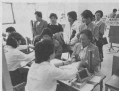
血圧測定は健康チェックの第一歩。

10月26日(水)、中央公民館で第14回市民の健康を守る大会が開催されました。当日は、公衆衛生功労者表彰をはじめ、健康に関する様々な展示や相談、体力測定、看護の実演などが行われました。最近の健康ブームを反映して、各コーナーでは、担当者に熱心に質問する姿が見られました。