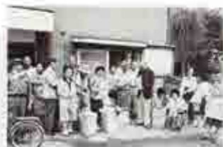
昭和54年当時の本町北口集会場。この辺りは近代的なビルに生まれ変わっている。