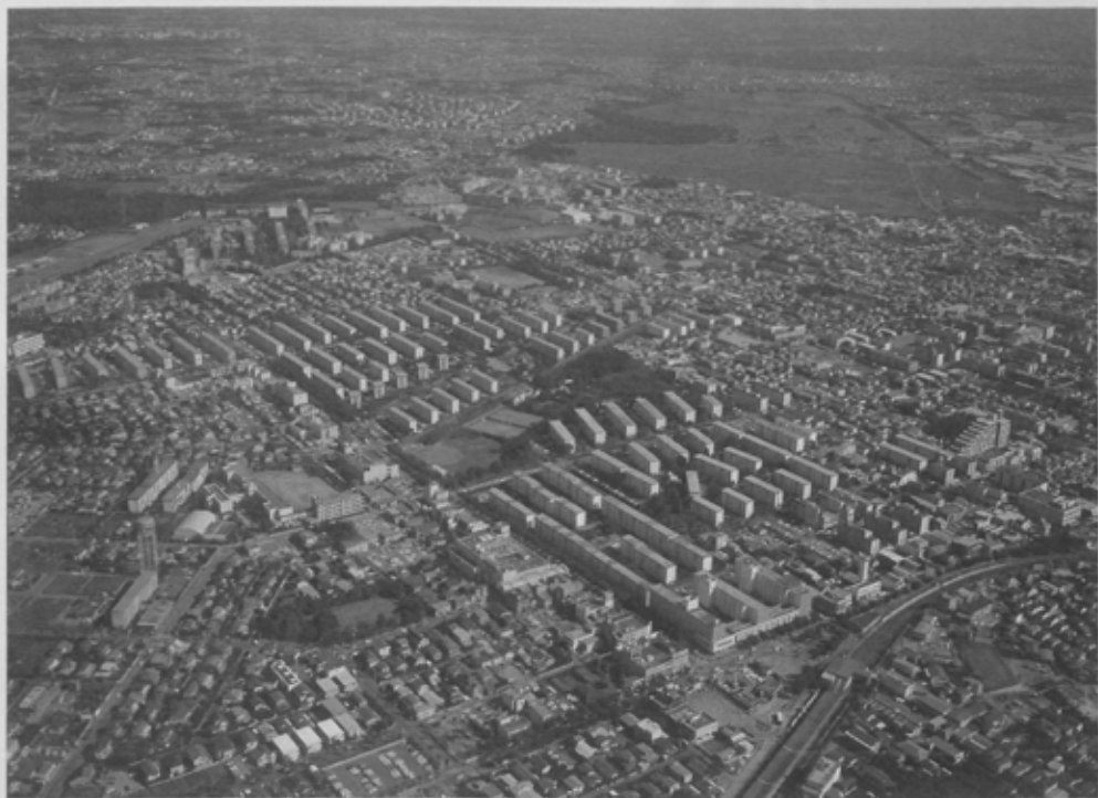
昭和42年2月入居を開始した習志野台団地。今、新京成線北習志野駅前では昭和66年の部分開業（西船橋～八千代駅間）に向け東葉高速鉄道の建設が急ピッチで進められている。開業後は都心がぐっと近づくと市民の熱い期待が集中。この路線はちょうど北習志野駅前通りの下を通過するが、このあたりはトンネルから地上までの地盤が柔らかく薄いので、地中に凝固剤を注入しながら掘り進んでいる。また、この団地の商店街樹木きたならでは、ユニークな行事や活動が行われ人気を集めている。