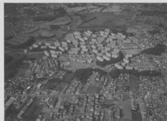
昭和46年8月に入居を開始した全彩台団地。賃貸が449戸、分譲が1098戸と、ほかの団地と比べ分譲の戸数が多いのが特徴。坂道と豊富な緑が静かな可並に合っている。