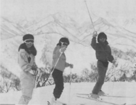
山頂は気温が大変低くカメラ内部で凍結を起こすことがあるので要注意。