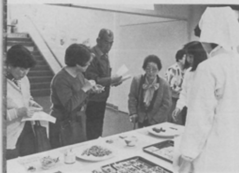
ヘルシーフードコーナーではアサリのブリッツが人気のだった。

第7回市健康展が11月3日・4日の2日間、東部保健センター(社会福祉会館内)で行われました。今年のテーマは「家族の幸せ健康から」。会場では、一般健康相談、婦人の健康相談、介護相談など様々な相談をはじめ、医師による講話、16歳以上の市民を対象とした胸部レントゲン検診などが行われ、両日で約1200人が入場しました。