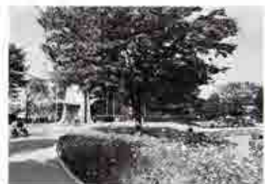
四季を通じて様々な花が咲き乱れる天沼弁天池公園。これからはひなたぼっこにもってこいの季節になる。