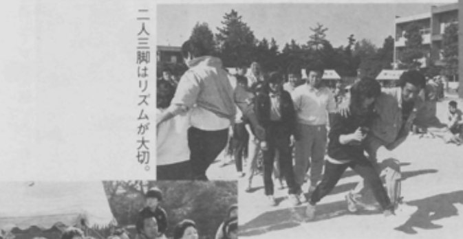
二人三脚はリズムが大切。

10月23日(日)、法典小学校の校庭を借りて、桐畑町会(藤原町3丁目)の第14回運動会が行われました。会場につめかけた約160人の皆さんは、障害物競争やじゃんけん大会などの競技に熱中。賞品のジャガイモやニンジンが大好評でした。