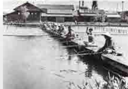
昭和23年当時の天沼弁天池。のどかに釣りを楽しむ人々の姿が見られた。その後家庭雑排水などにより汚れがひどくなり、昭和40年に埋め立てられ、現在の公園に生まれ変わった。