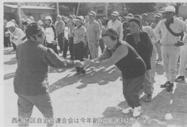
西船地区自治会連合会は今年創立30周年を迎えた