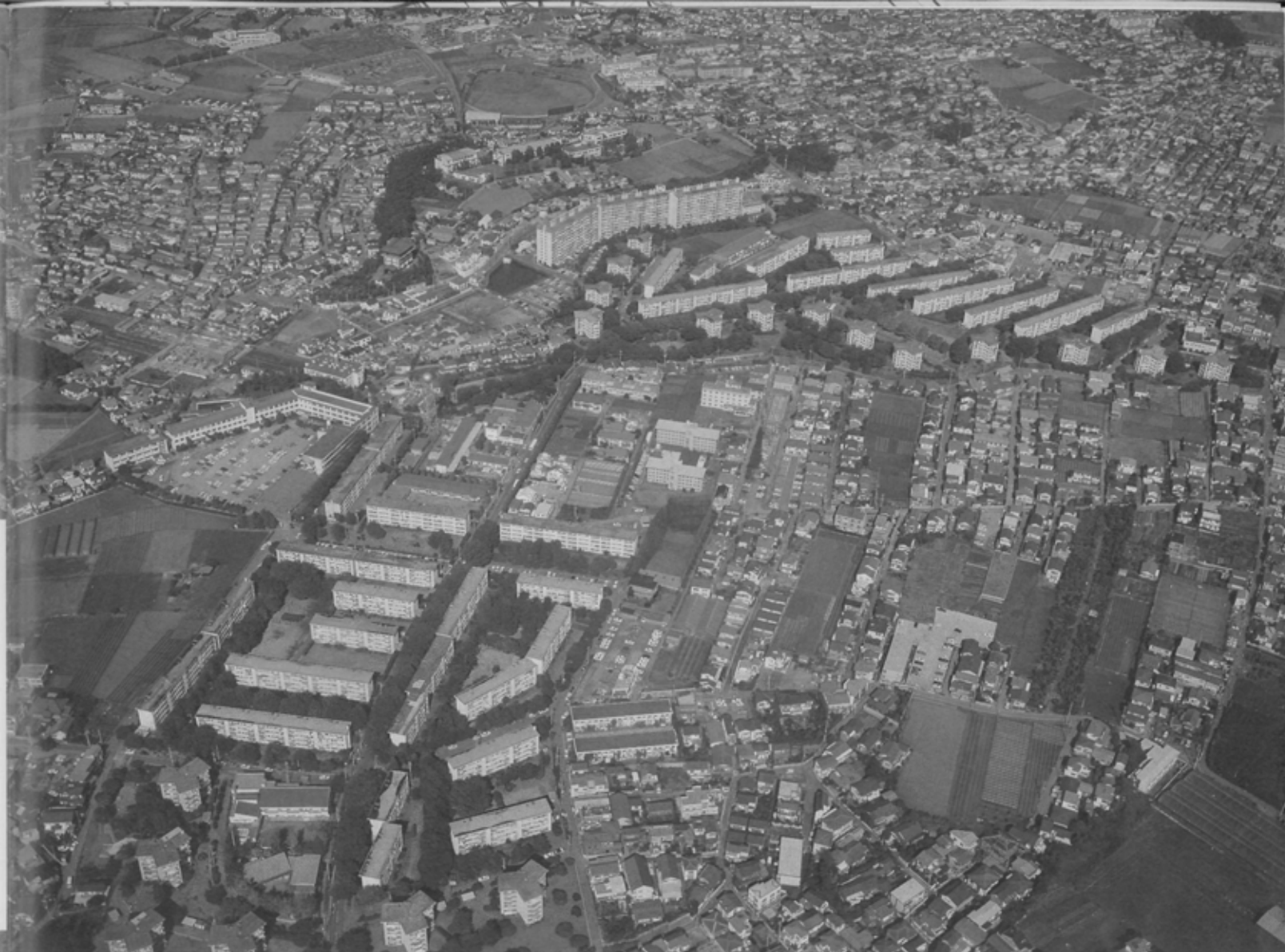
昭和35年市内で初めて入居を開始した前原団地。当時の家賃は安いもので月額6200円。水洗トイレやダイニングキッチンなど先進の生活様式が人気を集めた。