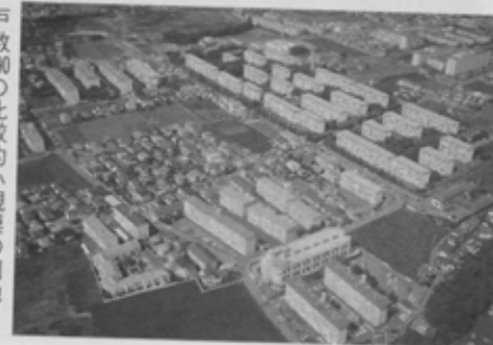
戸数60の比較的小規模の団地・夏見台団地。昭和43年2月に入居を開始した。このあたりは住宅やマンションが多く、にぎやかな住宅街をつくりだしている。