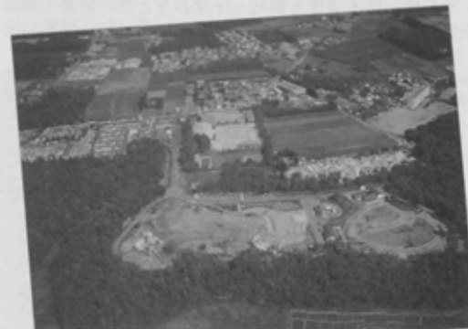
開園1周年のワンパク王国。10月15日、船橋市の平和都市宣言のシンボルとして「平和を呼ぶ」像が完成。制作者の岡本太郎氏らにより除幕式が行われた。