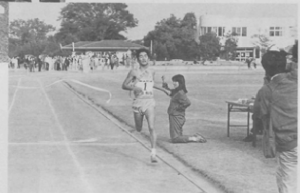
2時間8分28秒の大会新記録で四連覇。それも7人全員が区間賞という完全優勝だった。