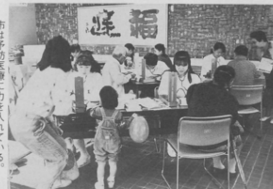
市は予防医療に力を入れている。