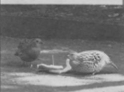
丸山の雑木林に現われたコジケイのつがい