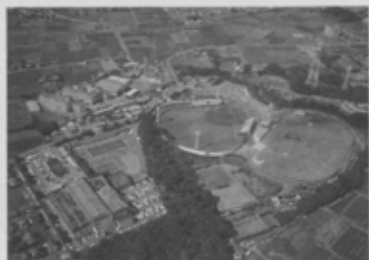
船橋市運動公園。陸上競技場中央スタンドを改修するなど、安全で楽しく機能的な施設の充実を進めている。