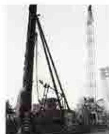
土留めの工事に使うSMW地地下駐車場の周囲に、571本のH鋼を打ち込み