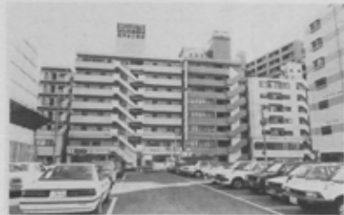
「来るたびに変わっているね北口は…」 近ごろこの言葉をよく耳にする。