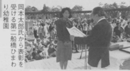
岡本太郎氏から表彰を受ける第二船橋ひまわり幼稚園