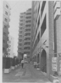
閑静なマンション街