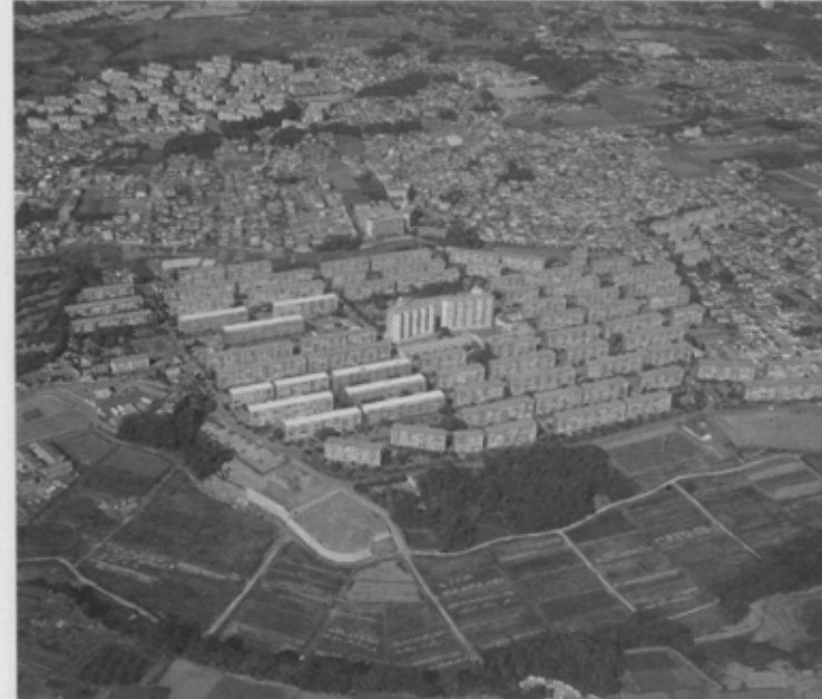
民間が開発した市内最大2,200戸の団地、緑台グリーンハイツ。祭りには手作りみこしが出るなど町会活動が大変盛んなまちだ。