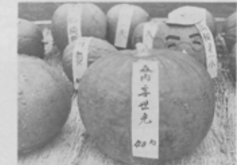
優勝したカボチャ。あなたとどちらが重いですか。