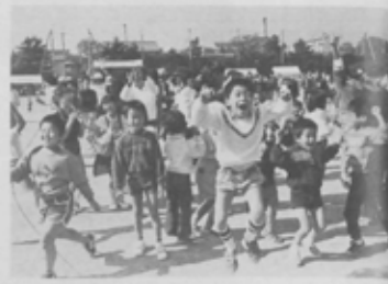
ここでもジャンケン大会は人気爆発

こちらは、11月3日(祝)に葛飾中で行われた第14回西船地区体育レクリエーション大会。西船地区は社宅やマンションが多く、新しく住み始めた人々と永くこの地に住む人々の融和に、この運動会は欠かせないということでした。