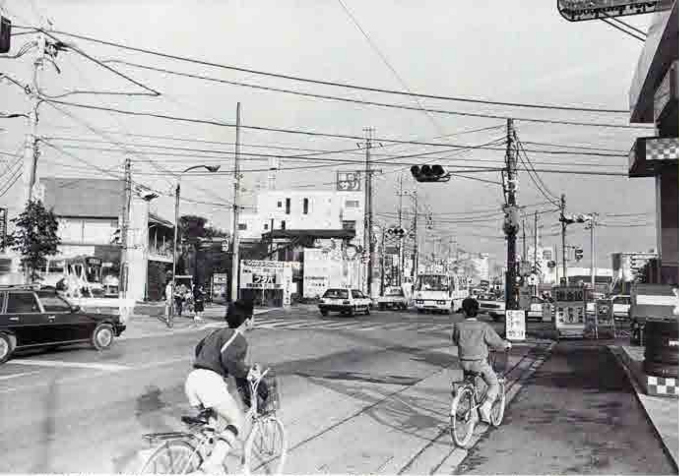
昭和30年代には未舗装で馬車がのんびり走っていたこの辺りも、朝夕のラッシュ時には、東京方面に向う自動車がひしめき合う。(海神方面から天沼交差点を望む)