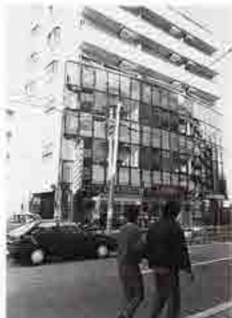
完成間近なマンション(本町6)