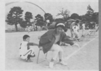
「ふうせんっておしりじゃなかなか割れないのネ」