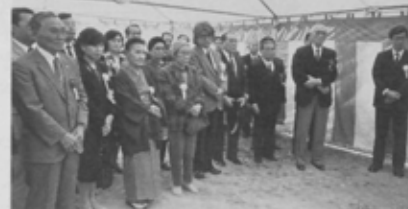
除幕式に訪れた関係者の皆さん。