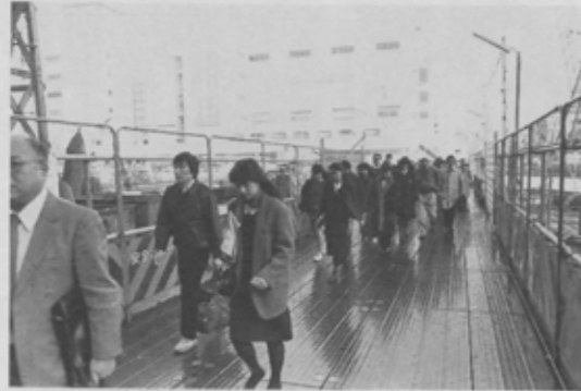
雨あがりの朝、足元を気にしながら 駅に急ぐ皆さん。工事中は大変ご迷惑 をおかけします。