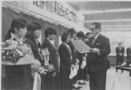
全日本女子ジュニア・クロスカントリー・リレー大会で優勝を飾った市船チームが11月25日、市役所で優勝報告会を行いました。