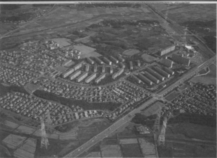
豊かな自然に恵まれた千葉ニュータウン小室ハイランド。約90haの区域内に1281戸、約6000人の市民が生活している。北総開発鉄道も京成高砂～北初富駅間を結ぶ2期工事にはいつている。