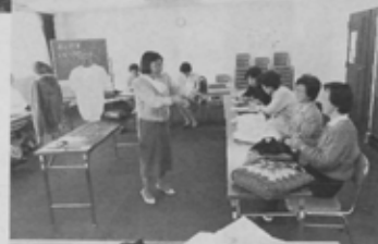
編み物は家事の合間のちょっとした時間を利用できるのも魅力です。