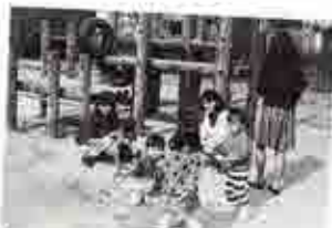
「毎日来ています」と若いお母さん。(本町北公園にて・本町6)