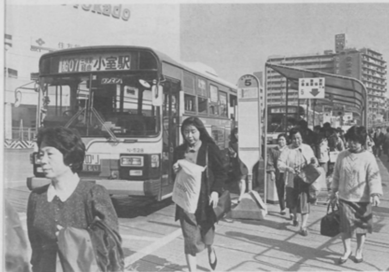
北口から出ているバスは11路線。1日の発着回数は 1810本で1日平均約4万人が利用している。