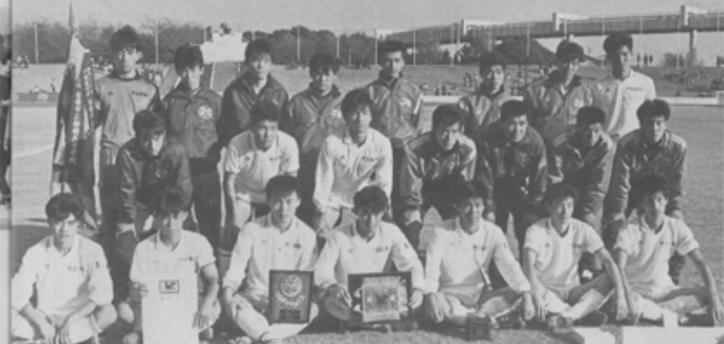
全国大会へのキップを4年連続で手中に納めた市船イレブン。

市立船橋高校が駅伝とサッカーの千葉県大会でそれぞれ優勝、全国大会へのキップを手に入れました。大会新記録で優勝した駅伝チームは、12月25日(日)京都で行われる第39回全国高校駅伝大会で二度目の優勝を目指します。また、昨年ベスト4まで勝ち抜いたサッカーも昨年以上の成績を目標に練習に余念がありません。ガンバレ、市船健児!!