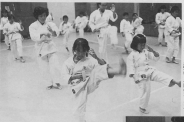
けいこを通じてがまん強い人に育てます。