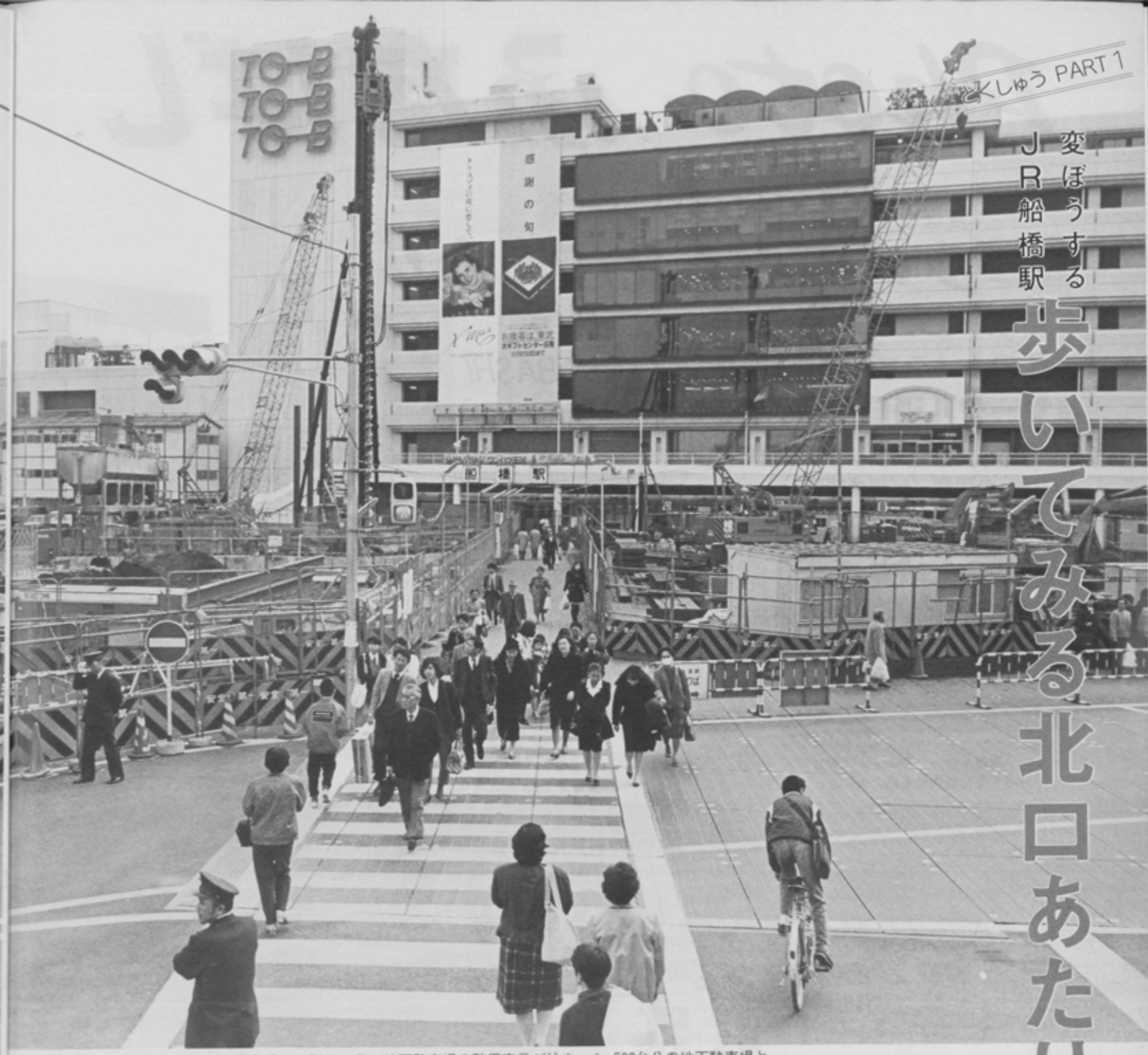
昭和65年秋の完成を目指し、北口地下駐車場の整備事業が始まった。523台分の地下駐車場と 県内で最大のペディストリアンデッキ(歩行者専用通路)を建設するもので、今北口には工事 のつち音が絶えない。