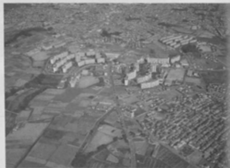
分譲・賃貸あわせて2247戸が入居する芝山団地は昭和52年に完成。東葉高速鉄道が昭和66年に部分開業すると、近くに（仮）飯山満駅が誕生し、大変交通の便の良い団地となる。