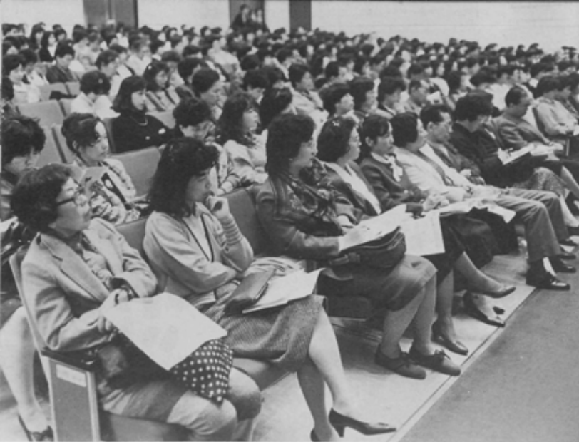
熱気あふれる満員の文化ホール。今年は男性の姿も目立ちました。