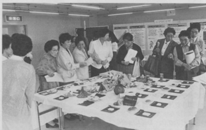
砂糖の量を知るコーナー。どら焼きには25グラムもの砂糖が…。