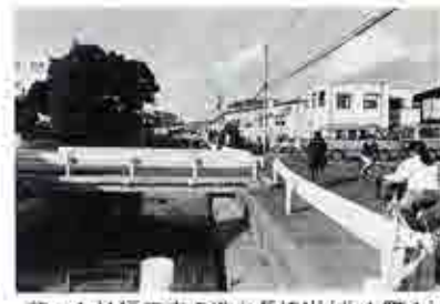
着々と拡幅工事が進む長津川(北本町1)