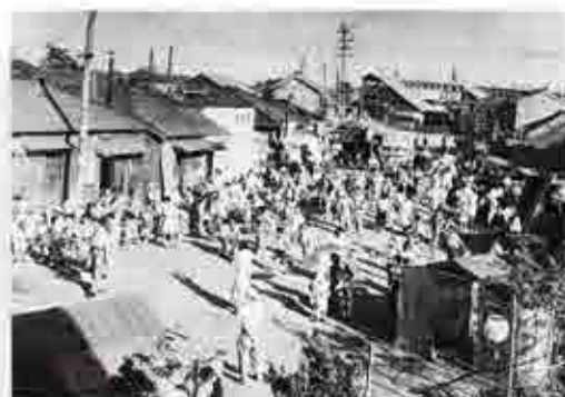
5年に1度行われている本町八坂神社の祭り。昭和28年国鉄船橋駅北口で撮影