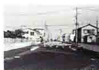
東葉高速鉄道の建設と共に付近の道路も着々と整備が進む。(本町7丁目付近)