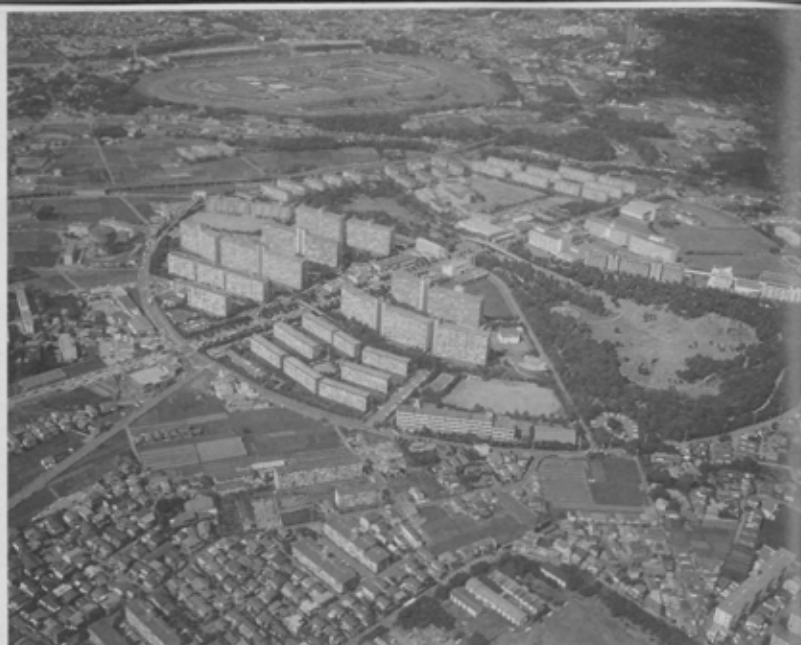
昭和50年、旧海軍行田無線塔跡地に建設された行田団地。賃貸・分譲併せて1737戸が入居している。団地と公園の周囲を丸くはする道路の半径は約200m。円内の広さは東京ドーム約2.7個分にあたる。写真上には改装中の中山競馬場が見える。