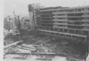
駐車場は地下13mまで掘る。