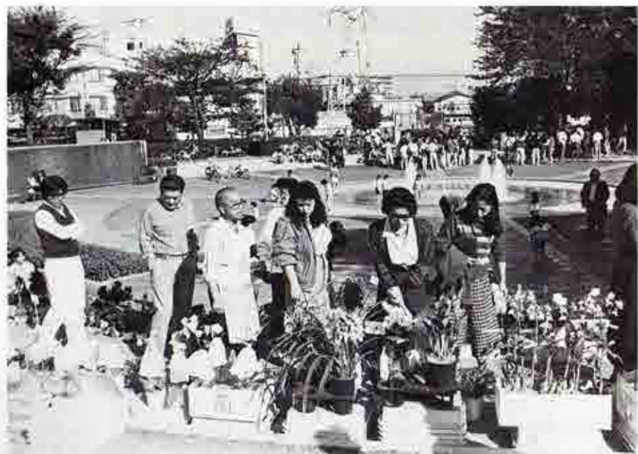
天沼弁天池公園で行われる「緑と花のジャンボ市」。買物帰りにちょっと寄り道。ここは文字どおり都市生活者のオアシスだ。