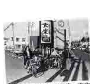
右は県道夏見・小室線。市内の県道の延長は51,562mある。