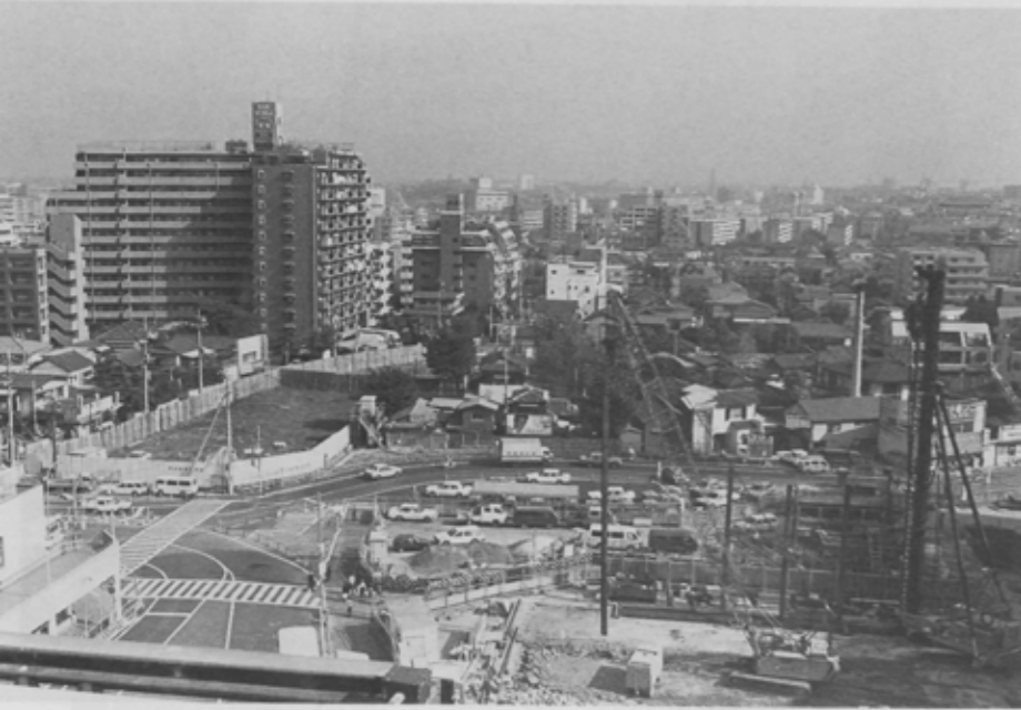
都心までわずか20数分。船橋駅北口にはマンションが林立する。