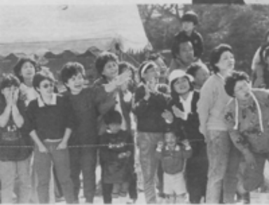
「おとーさんがんばってー。」 大人も興奮

11月3日には、高根・金杉地区体育レクリエーション大会が御滝中で行われました。当日は、高根町会など15町会の皆さんが参加、綱引、玉入れ、町会対抗リレーなどに大ハッスル。お父さん・お母さんの軽い身のこなしに、子どもたちも大声援を送っていました。