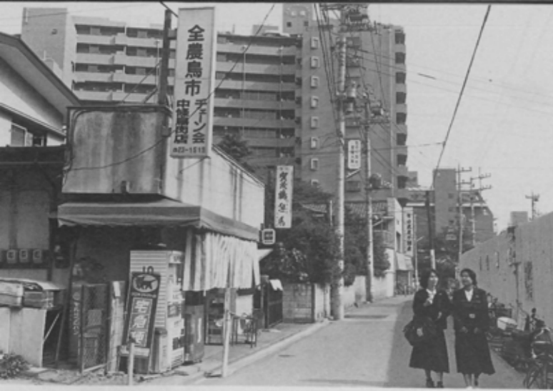
「横丁」という言葉がだんだん似合わなくなってきた北口界わい。