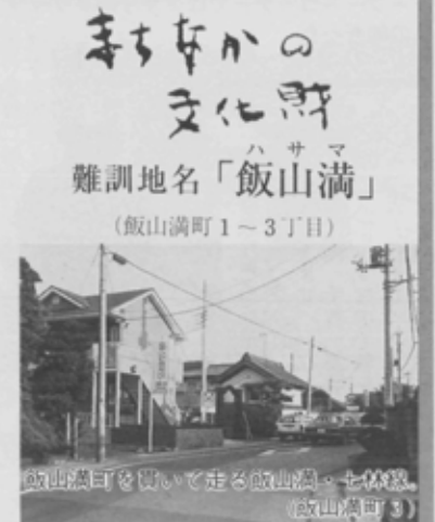
飯山満町を歩いて走る飯山満。七林院(飯山満町3)

「飯山満」と書いて「ハサマ」と読む。ちよつと読めない。柳田国男先生はその昔「地名の研究」(昭和11)の中で、「ハサマは関東などでは、全然耳にせぬ地名だが、その分布は存外広く」と云っており、西は山口県で盛んに地名になっているし、東北でも、と例を挙げていた。関東などでは「ハサマ」は「ハサマ」といけれども、尾張の暴れん坊、織田信長が東海の覇者、名門大名の今川義元を奇襲に導いた補扶間(おけはさま)を想起するにちがいない。「ハサマ・ハザマ」はクボ・ヤツ・サコ・サワなどと同類語で「谷合い」の意味とされる。飯山満にもそんな場所があるが、補扶間だつてそうなんだろうと思う。戦後の住居表示法の実施により全国的に従来の地名の改変が行われ、時に性急に走ったか、マスコミ等で「改悪」の例などが大きく話題にもなり、その後改正もあって、近年ではどみに、地名は文化財」との一般の認識も高まってきている。本市でも「小栗原」、「葛師」と旧町名の継承の碑が建てたが、この「飯山満」、難訓地名中の難訓とあって、住民・行政の英知はどう裁きを付けることになるだろう。