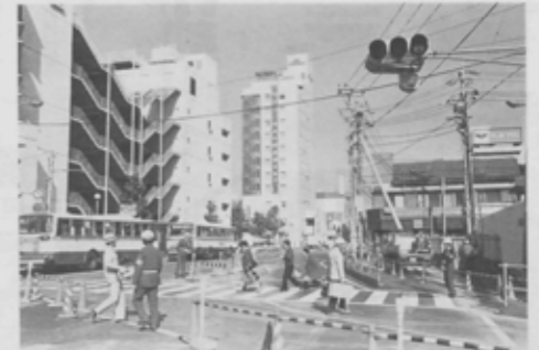
ペディストリアンデッキが完成すると人と車が 平面交差することがなくなる。大型エスカレー ター4基、エレベーター1基も完備される。