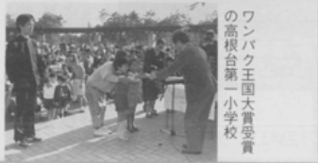
ワンパク王国大賞受賞の高根台第一小学校