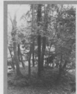
ゆるぎ地蔵(市指定文化財)下にある旧弁天島。(飯山満町2)