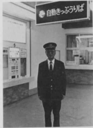
東武・新船橋駅にて