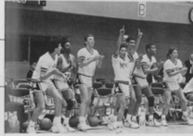
得点するごとに仲間をたたえるモロー高校のチームメイト。