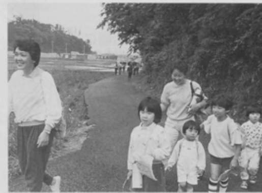
運動公園まであとひと息。ゴールのタイムが気になります。

第5回全国一斉ウォークラリー大会が、5月15日(日)行われました。当日は、時々雨が降るといふあいにくのお天気でしたが、足に自慢?の皆さん約1,300人が参加、市内のJRや私鉄の各駅から夏見の運動公園を目指しました。一番遠い北総開発鉄道の小室駅から36人が挑戦。全員見事に完走しました。ウォークラリーは、速さを競うスポーツではないので、子どもからお年寄りまで気軽に参加できます。あなたも次回は挑戦してみてください。