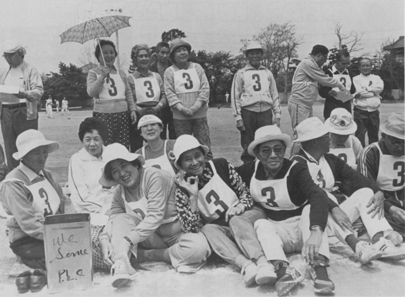
船橋市老人大学卒業生による初めての「老大祭」が、4月24日(日)、宮本中学校で開催されました。快晴となったこの日、スポーツ健康大学のOBやポートライオンズクラブ、それに船橋市陸上競技連盟のみなさんも応援のために集合。会場では老人大学の1期から5期までのOB約300人が各期別ごとに9つのチームに分かれ、2人3脚やスプーンレースなど、様々なゲームを競い合いました。

“日本一の防災訓練” 9月1日「防災の日」に高瀬町運動広場 で6都県市合同防災訓練が実施されます。 ぜひご参加を!!