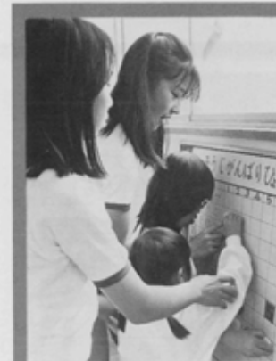
やさしいお姉さんたちと

写真の分野は様々です。私の場合「我が子の成長を撮る」という軽い気持ちでカメラを手にしたのですが、瞬間の表情、光と影の変化など、写真の深さにふれ、絵画とはひと味違った趣に魅せられて興味は更に広がっていきました。PTAの広報活動で、学校の子どもたち、ベランダに咲く花、食卓のコップ、窓から眺める夕景生活の中で身近なところに被写体は山程ある事にも気がつくしました。