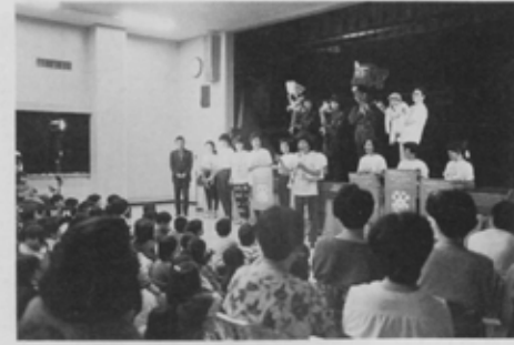
夏の祭典の説明をする関係者の皆さん。