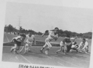
団体対抗障害物リレー