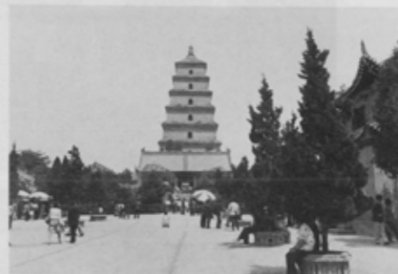
西安市のシンボル大雁塔(だいがんとう)