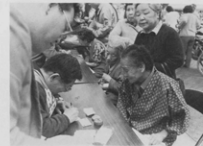
イザというときの「やすらぎカード」がお年寄りに大人気。