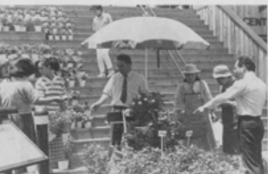
グリーンフェア船橋の一環として毎年行われているグリーン・ミニ・バザール。今年は5月18日(水)から20日(金)まで市役所前のABCハウジング船橋住宅公園で開催されました。

“日本一の防災訓練” 9月1日「防災の日」に高瀬町運動広場 で6都県市合同防災訓練が実施されます。 ぜひご参加を!!