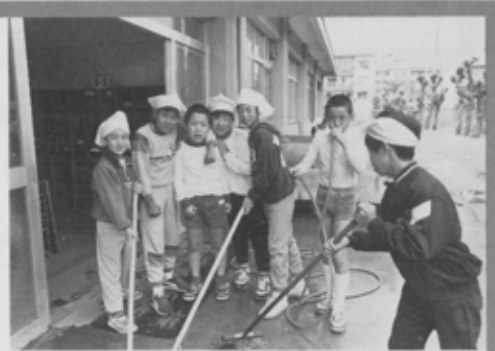
清掃もみんなでなかよく

特にモノクロはそこに人間性と懐古的な雰囲気があり、作品としても手作りの感があり私は大好きです。今回撮影した薬田台小学校のひまわり学級(特殊学級)と普通学級との交流は、子どもたちの自然な姿であり、福祉の原点でもあり、今後も私のテーマとしたいと考えています。そして願わくば「障害者と共に。そんな啓蒙に足る写真が撮れるといいな」と思っています。(船橋市写真連盟会員)