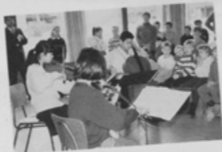
市内の小学校に招かれた小栗原小の子供たち。小さな親善大使をつとめた。