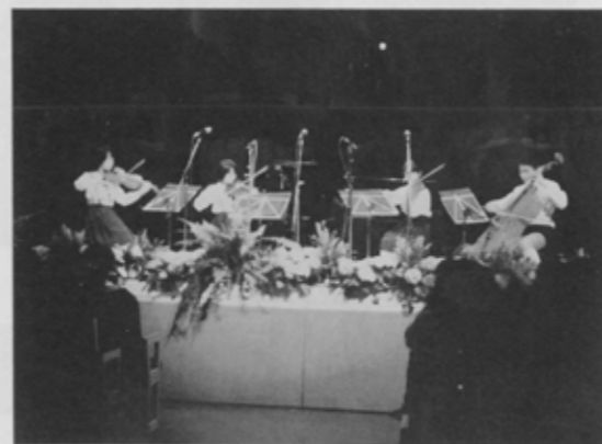
「姉妹都市の夕べ」で弦楽四重奏を披露する小栗原小の子どもたち。