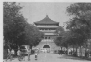
西安市の中心に建つ鐘樓