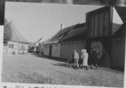
オーデンセ市内にあるアンデルセンの生家