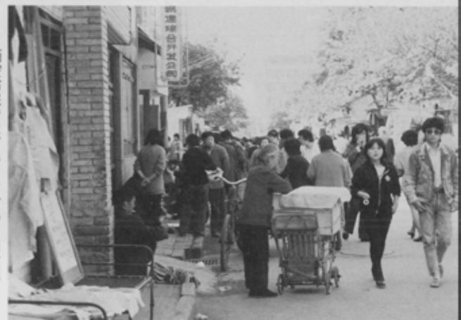
西安市民でにぎわう夕方の自由市場