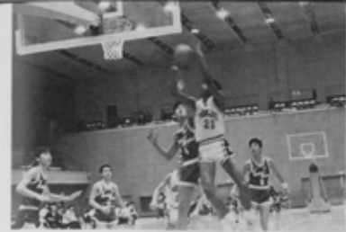
好ゲームとなった親善試合。シュートのたびに場内がわいた。