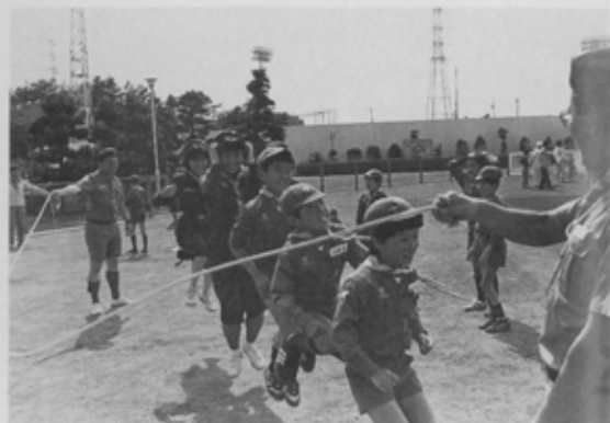
チームワークがモノを言います。長なわとび