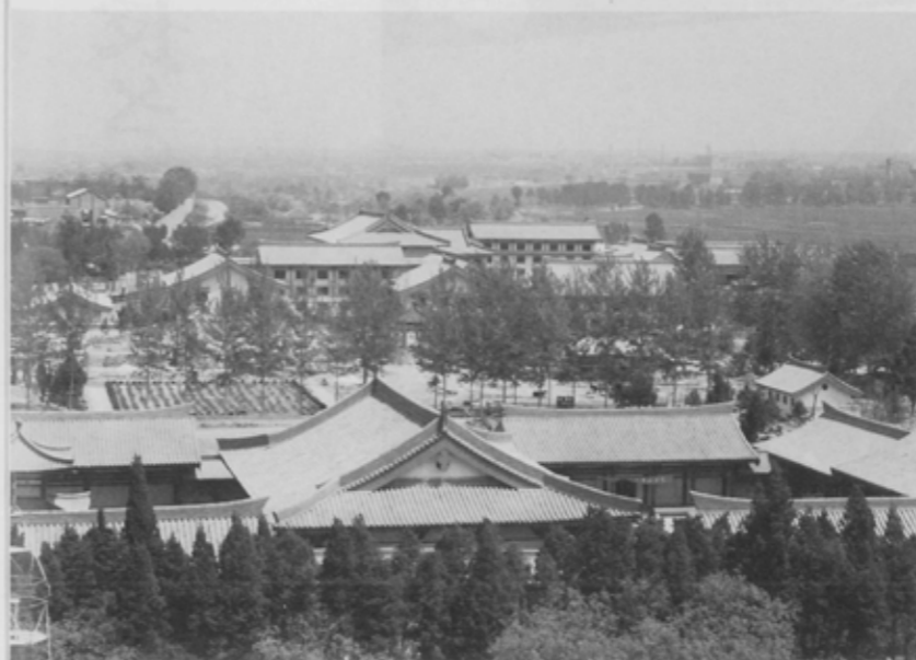
大雁塔から見た唐華賓館(中央・上)。手前は博物館。

合意書の内容は、日中共同声明および日中平和条約の精神をお互いに十分尊重して、両市の間でスポーツ・文化・芸術・経済などの分野でさらに交流を深めようというもの。この合意書が結ばれたことにより両市の関係が新しい時代を迎えることになります。