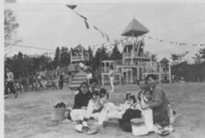
父の日は、親子そろって

6月19日父の日は、日ごろ仕事に忙しいお父さんに、緑の中でゆっくり休んでいただくとうとう「父の日のゴロ寝会+ゴロ寝したお父さんを描いてみませんか」を開催します。お父さんには手づくりの木のマクラ、オリジナルタオル、ジュース1本を進呈して自由にゴロ寝を楽しんでもらい、一緒に来たチビッコにはお父さんのゴロ寝姿を描いてもらいます。当日午前11時と午後2時からワンパク城けいじゅつコーナー前で受け付け。各回先着の親子100組。また、7月17日から行われる「ワンパク王国たなばたまつり」に向けて、子どもたち手づくりのたなばた飾りも募集しています。