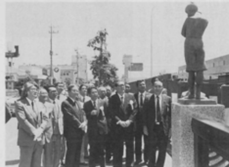
市場通りの海老川に架かる富士見橋の高欄が完成し、5月9日(月)除幕式が行われました。海老川に架かる12本の橋は、改修工事にあわせて夢のある楽しい橋に次々と生まれ変わっています。