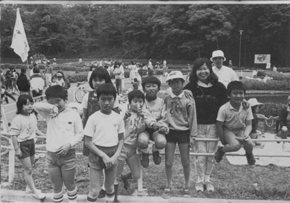
今日はボくらが主役です。