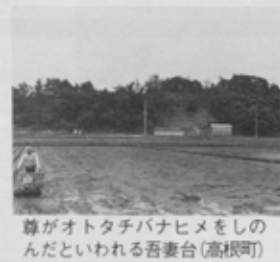
尊がオトタチバナヒメをしのんだといわれる吾妻台(高根町)

尊は、この度の勝利は、天の神々のご加護だと考えていました。そこで、夏見の高天原(たかまがはら)という高台に登り、ここで感謝の祈りをし、ここで、それを一段落して、周囲を見渡しました。まず、