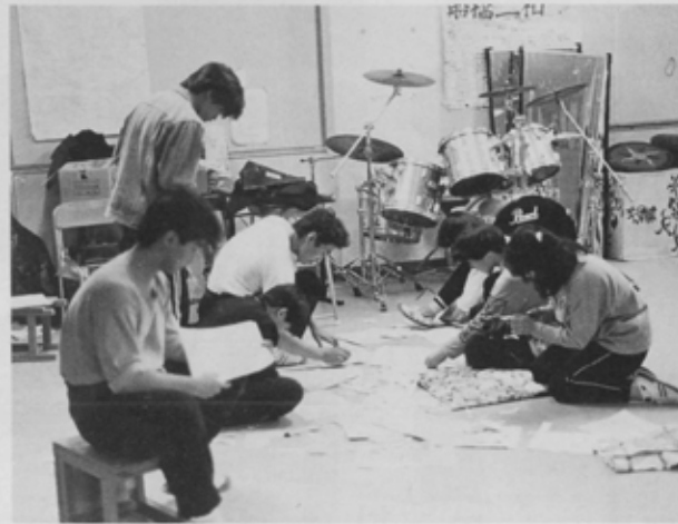
1つの目標に向かって皆んなが力を合わせる。

県立船橋二和高校演劇部が、8月に熊本で開かれる全国高校総合文化祭に向け連日猛練習を続けています。同校の演劇部は、創部以来、輝かしい歴史を持ち、昭和61年の同大会では最優秀賞を授賞しています。今年1月の関東大会でも最優秀賞となり、関東甲信越代表として出場することになったものです。7月29日(金)には文化ホールで、今ヶケコ中の「ある夢」を上演します。皆さんも、若さと熱気あふれる舞台を体験してみませんか。