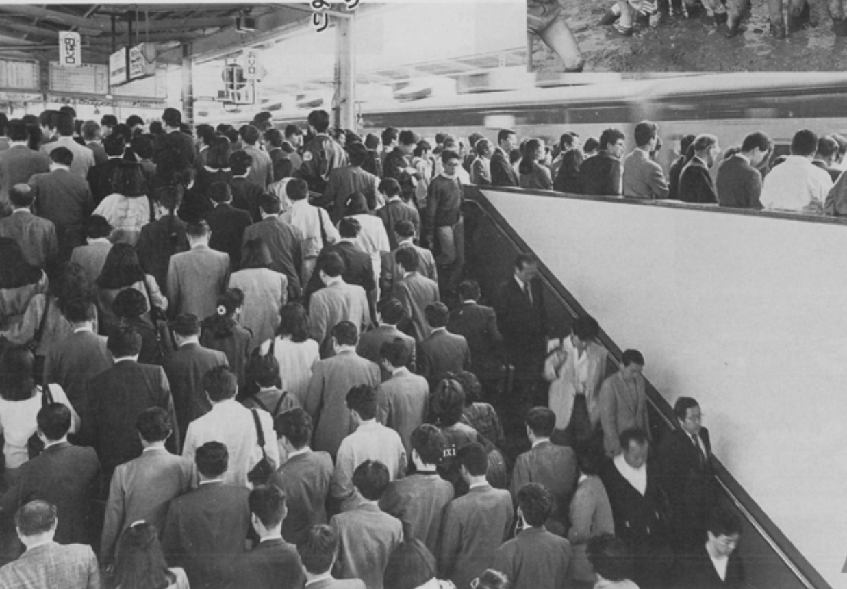
千葉県下乗降客数ナンバーワンを誇るJR船橋駅の朝