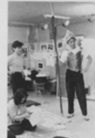
舞台に合った衣装を作る。これも大事な作業です。