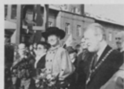
オーデンセ市千年祭に列席されたデンマークのマルガレーテ2世女王とフレデリック殿下。