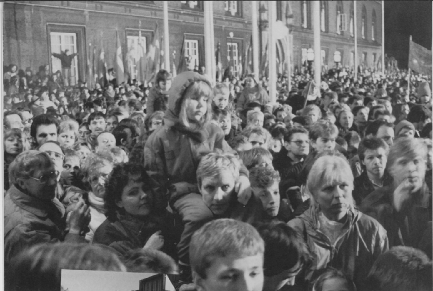
アンデルセンが世界的な童話作家となって故郷オーデンセ市の名誉市民に迎えられて以来のたいまつパレードが行われ、4万人の市民が集まった。