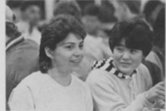
姉妹都市ハイワードからのお客様