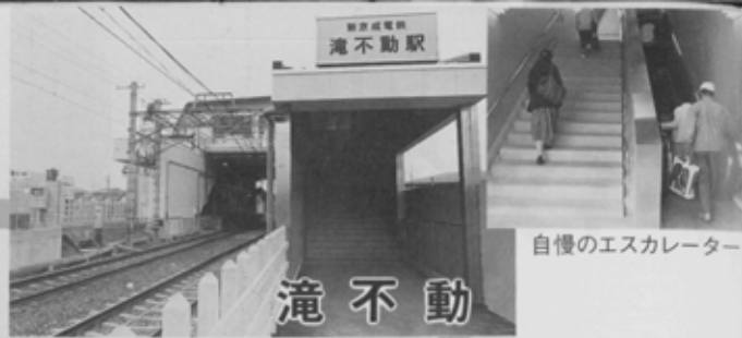
自慢のエスカレーター

昭和63年4月1日に新しい駅舎が完 成した。朝7時から8時までがラッ シュユとき。(6,400)