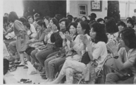
お母さんも一緒に楽しめました。