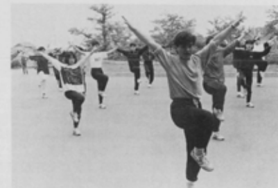
しなやかな体づくりにはトレーニングが欠かせません。