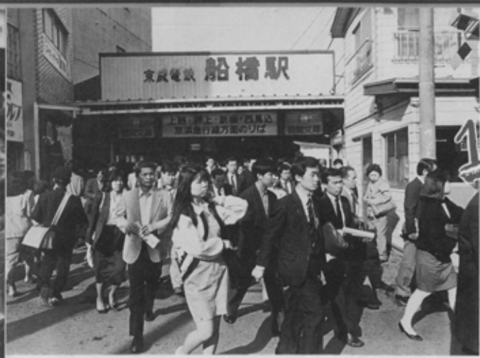
1日の平均取扱収入は843万円。5位の上野駅をはるかにしのいで京成全線中ナンバーワンの京成船橋駅。