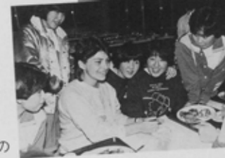
モロー高校は生徒数1200人の男女共学のミッションスクール。クラブ活動が大変盛んだ。