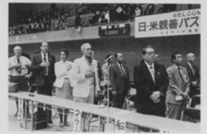
試合前、星条旗に忠誠を誓うアレックス・ジュリアーニ市長(中央)ら、ハイワード市の一行。