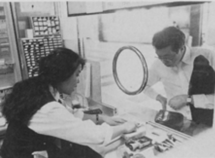
JR東船橋駅のステキな駅員さん