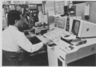
コンピューターで定期券を素早く発売。新京成北習志野駅。