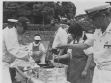
船橋海洋少年団のイワシの天ぷらは大好評！

こどもの日の5月5日、船橋市運動公園で第21回船橋市少年少女交歓大会が開催され、約11,000人の参加者でにぎわいました。文字どおり五月晴れとなったこの日、市内から集まった子どもたちは、開会式のあと各会場に分かれ、野球場ではぶっつけ野球、プールではどじょうのつかみどり、陸上競技場ではサッカーやインディアカなど、盛りだくさんの催し物に大はしゃぎ。大人たちも、この日だけは童心にかえり、スポーツやゲームに熱中していました。