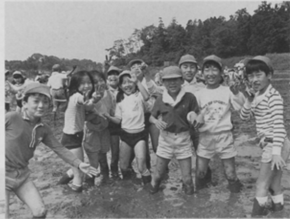
田植えの体験学習をする高根小の子どもたち