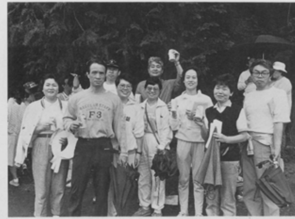
楽しく歩く。これがウォークラリーの原点です。