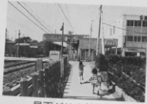
昼下がりの前原駅