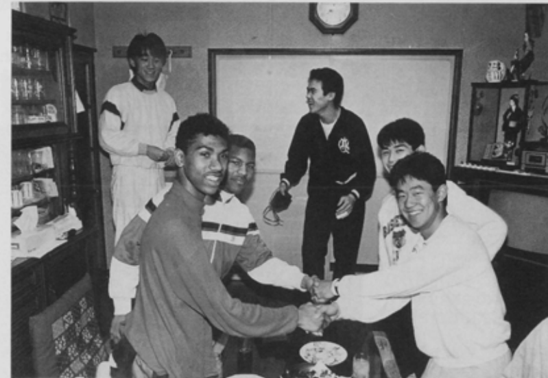
国際交流のナイスパス。滞在中、モローハイスクールの選手は、市船バスケットボール部員などの家に2泊ホームステイした。