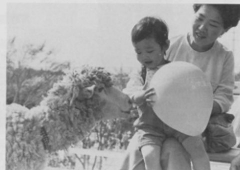
さくら公園のテーマは「花と緑の広場」。公園にはいつも温かな出会いがある。

桜の新名所「高根台さくら公園」が、4月17日(日)オープンしました。敷地面積は約6800㎡。樹齢40年の桜21本を含め60本の桜並木が整備されています。この公園は、船橋初の下水処理場として運転をしていた「高根木戸終末処理場」がその使命を終えたことから、長い間ご協力をいただいた市民の方々への要望を生かし建設したものです。当日は、記念パレードやミニ動物園など数多くのイベントが行われ、家族連れの方々ににぎわいました。