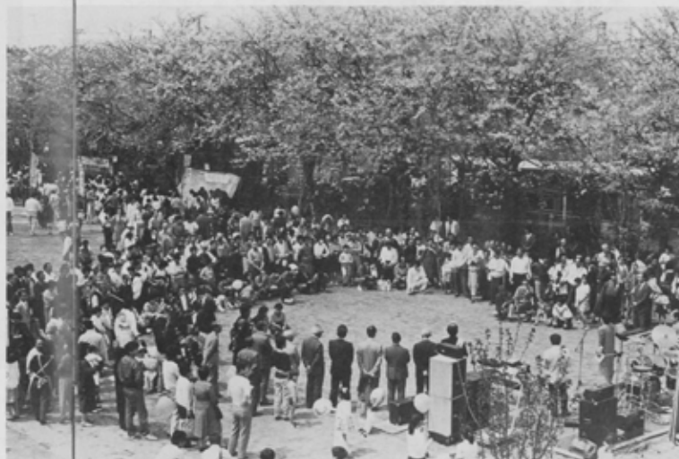
近くに公園があればという市民の声を生かして「高根台さくら公園」は完成した。