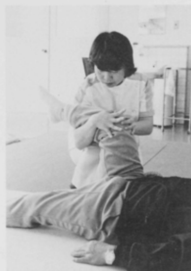
身体障害者福祉センターには障害者リハビリ施設があり機能回復訓練が行われています

50万都市船橋の「福祉の殿堂」船橋市社会福祉会館がいよいよオープンしました。船橋市が全国に誇るこの総合施設は、鉄筋コンクリート造り3階、地下1階建てで、延べ面積は4794平方メートル。その場所も新京成線習志野駅から歩いてゼロ分という利便さ。この中に、健康相談や乳幼児の保健指導などが行われる「東部保健センター」、障害者リハビリ施設などのある「身体障害者福祉センター」、肢体の不自由な子ども達が訓練できる施設をもつ「東簡易マザーズホーム」、お年寄りたちのいこいの場として造られた「東老人福祉センター」、母子家庭のための生活相談などができる「母子福祉センター」が設置されています。開館以来、各施設には、連日多くの人たちがおとずれ、大変好評を博しています。