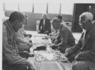
時を忘れる勝負のひとつ