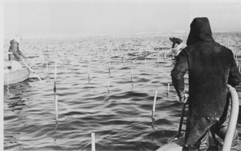
「海苔とり、向う側に浦安行徳方面が見える」