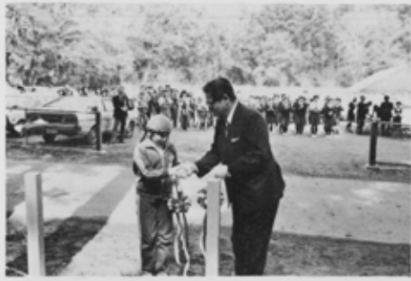
テープカットの青少年代表と大橋市長