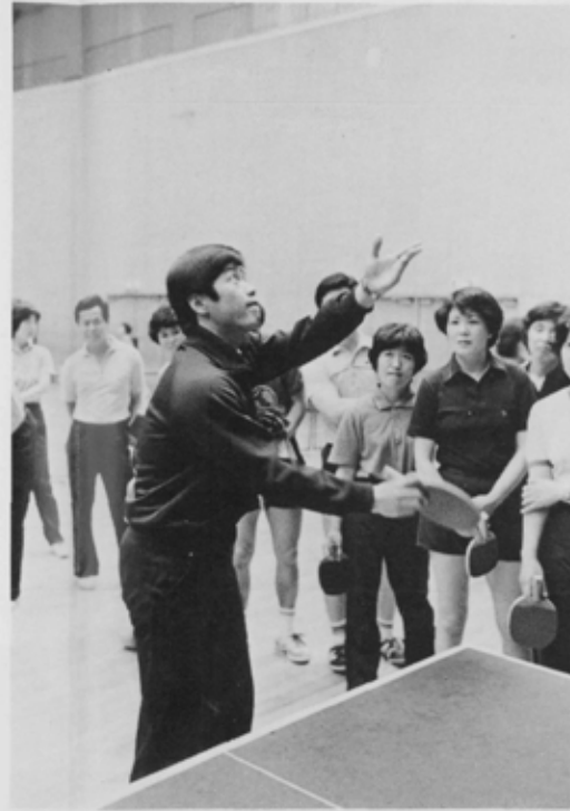
高度なテクニックに思わずかたずをのむ