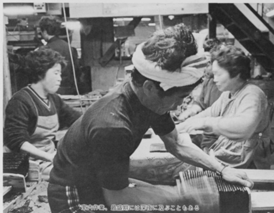
「室内作業、最盛期には沢山に及ぶこともある」