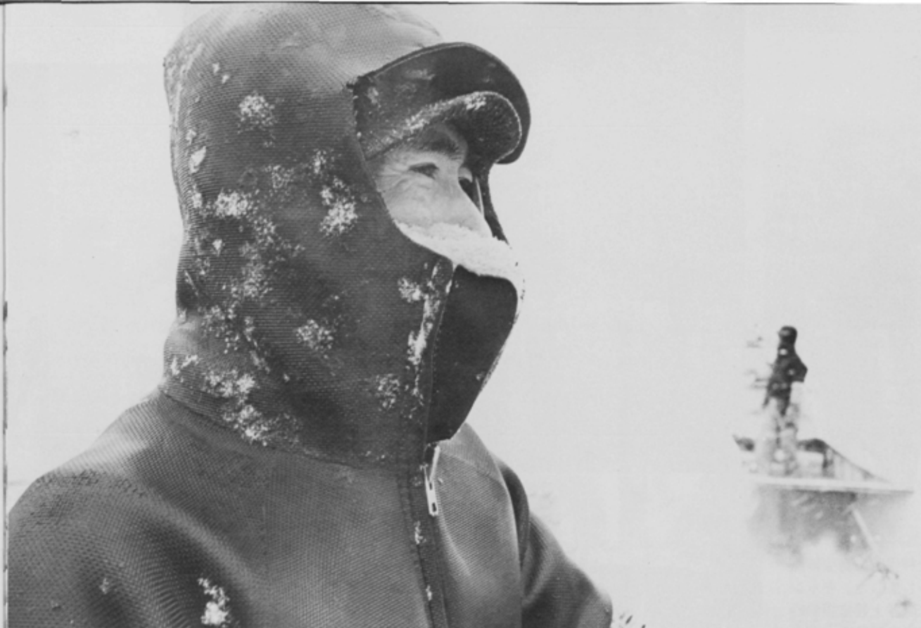
「帰舟、今年は雪が多かったが海苔作りには通していたという」