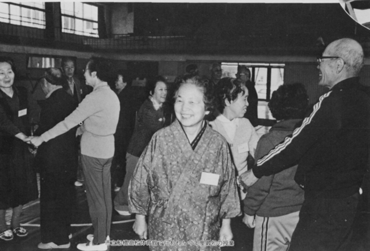
市立老人大学で今年度最初の授業