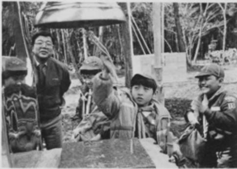
広場に設置された「希望の鐘」

この程、市北部大神保町に青少年キャンプ場がオープンしました。キャンプ場の広さは運動公園陸上競技場の約5倍あり、深い杉木立の野鳥のさえずりも素敵です。炊事場、トイレ、ファイヤー場、広場、避難棟、駐車場などの施設が整備されています。