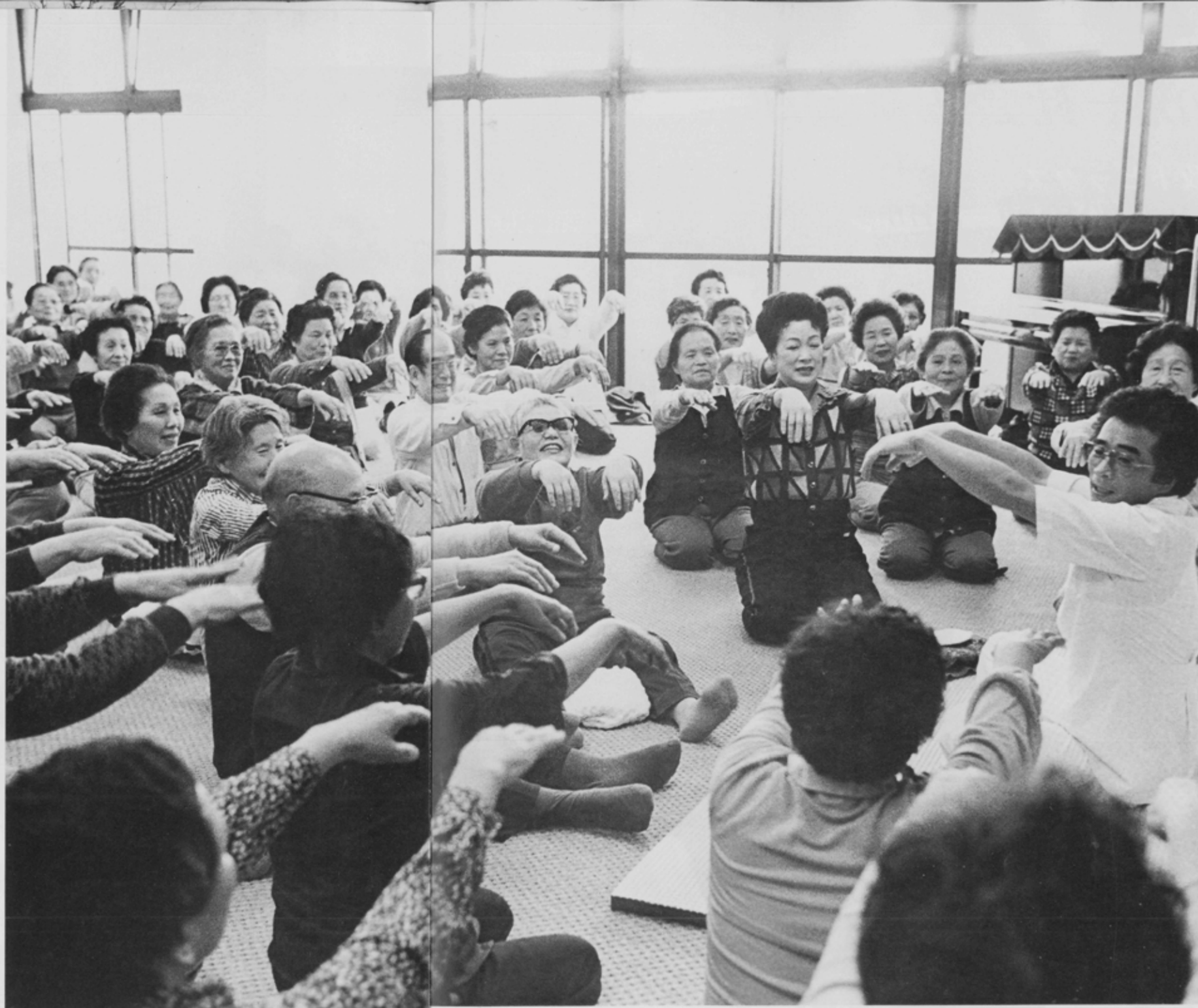
元気一杯体操をするお年寄り達 東老人福祉センター