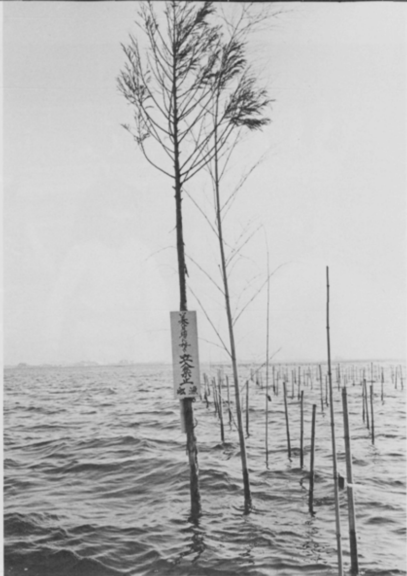
「ぼんげ、漁師はこれによって舟の位置を知る」