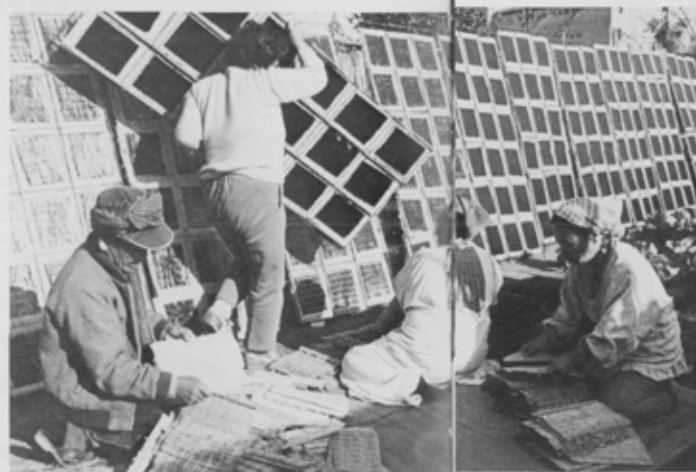
「今では珍しい天日干し(海神町)」