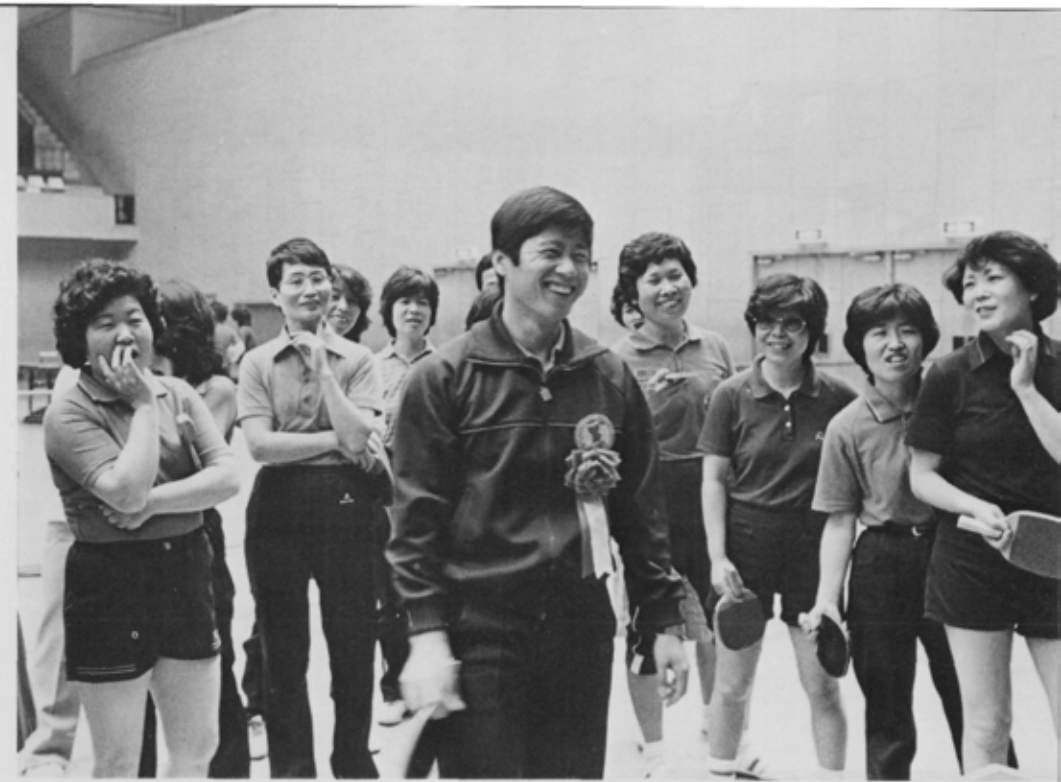
さわやかな笑顔が印象的な世界チャンピオン