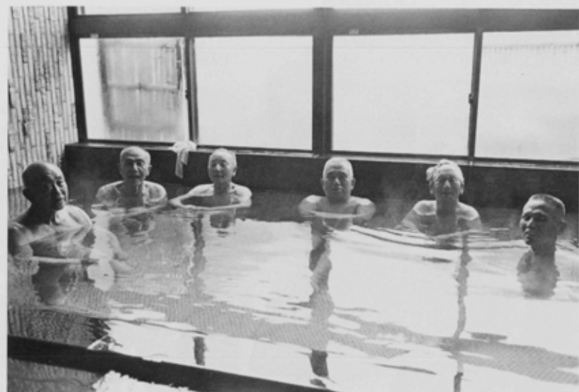
いつでもゆっくり汗が流せる大浴場 東老人福祉センター