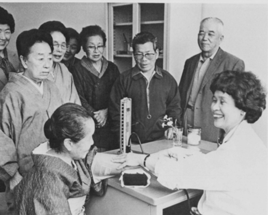
血圧測定も和気あいあいと 東老人福祉センター