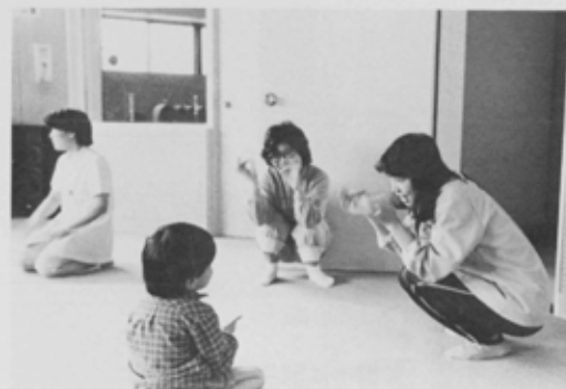
東簡易マザーズホームは小学校に入るまでの肢体の不自由な子供達が訓練を続けています