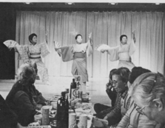
活気あふれる舞台つき大広間