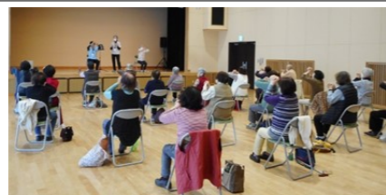
シルバーリハビリ体操

1月22日、2月5日、3月4日 全て月曜日 時間：午前10時～ 会場：北部公民館講堂