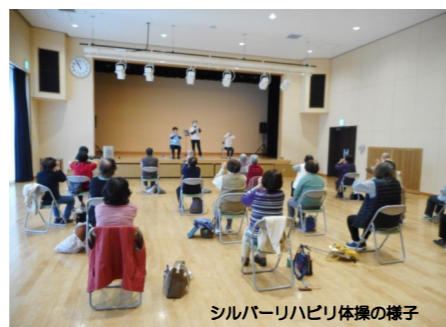
シルバーリハビリ体操の様子