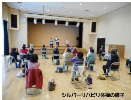
シルバーリハビリ体操の様子