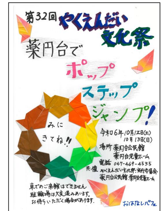
作 おはなしパフェ