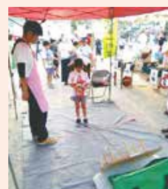
ボランティアによる出店のお手伝いの様子