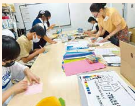
ブックフェアの展示準備