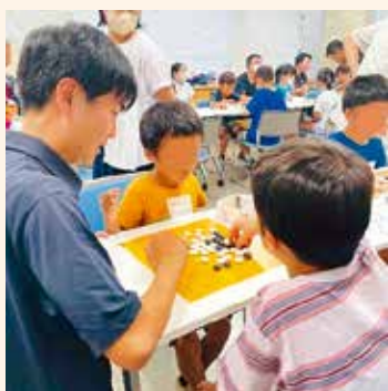
囲碁の対局の補助