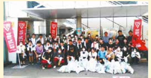
参加者で集合写真!