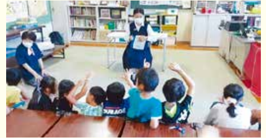
ボランティアの読み聞かせ