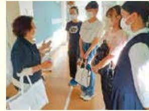
事前打合せの様子

彼女達自身の創作した絵本による語りかけは堂々としたもので、会員に勝るとも劣らないものであり、聴講の子供達14名は楽しそうに聞き入っていた。「おにやんま」の活動に敬意を表するとともに益々のご活躍を祈念します。