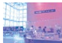
平成15年4月 市民活動サポートセンター設置