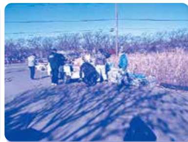
海老川調節池清掃・ゴミ集積場所