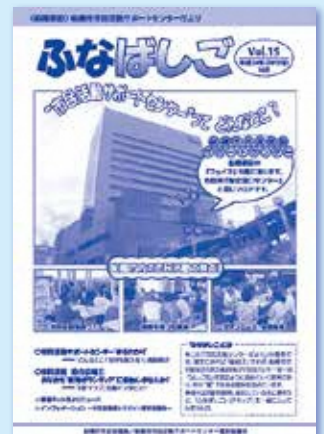
第15号から「ふなばしご」として発行