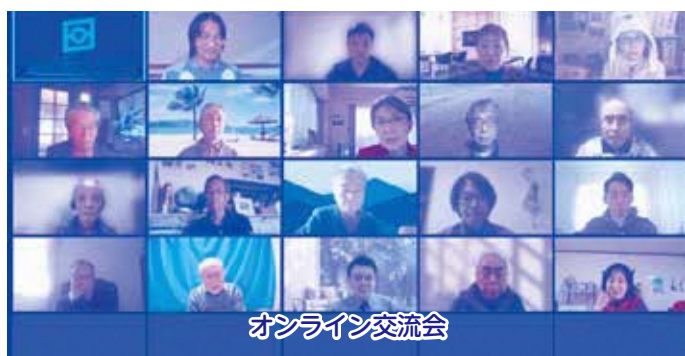
オンライン交流会