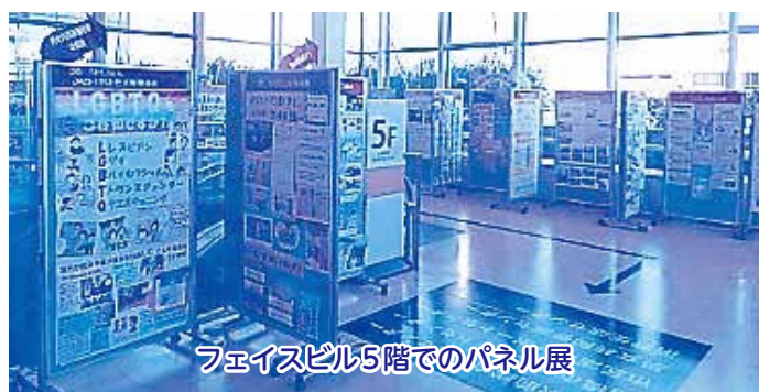
フェイスビル5階でのパネル展