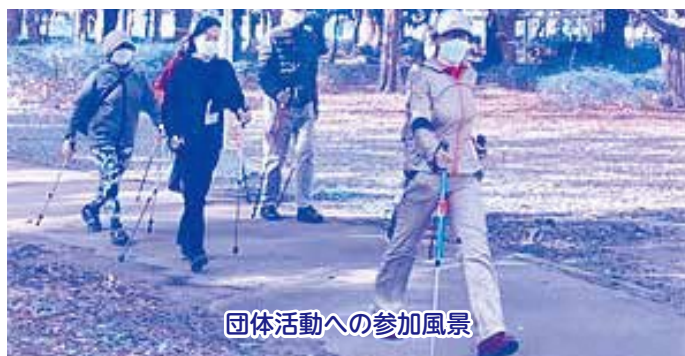
団体活動への参加風景