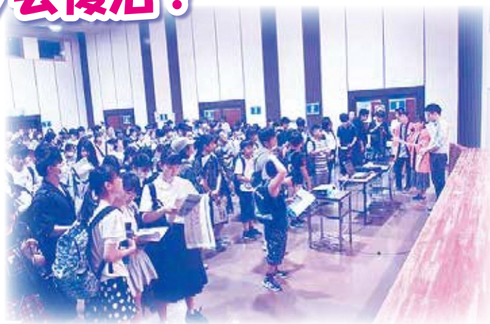
※写真は令和元年度のマッチング会の様子です。