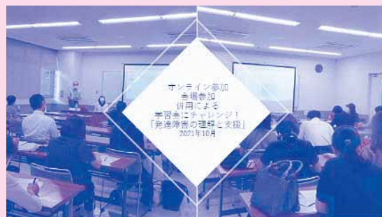
【学習会の様子 2021年10月】

担当者より：2021年度は10月と3月にオンラインと会場参加を併用した発達障害に関する学習会を開催しました。子育て中や気力・体力の低下などで外に出にくい方、ご高齢やスマホやパソコンをお持ちでない方も、ご自分に適した参加の仕方を選択していただき、参加・視聴していただくことができました。参加者の声を基に、次は、発達障害のある人の就労支援とライフスキル支援をテーマに、学習会の準備を進めています。今後も、地域の中での情報発信と連携を大切にして、活動を続けていきたいと考えています。ご支援をよろしくお願い申し上げます。