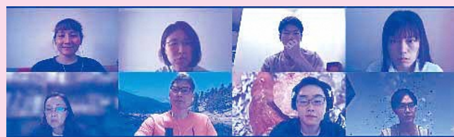
【オンライン交流会の様子】

担当者より：LGBTQへの無理解や偏見が社会課題となっている一方で、知る機会や会う機会が少ないため、身近に当事者がいないと考える人が多いことが実情です。広報をしかけ、船橋市でも多様な性を語る場を作ってきました。船橋市民にももちろんLGBTQはいます。身近にはいないのではなく、話せない社会であることが少しでも浸透していくと良いなと思っています。フライヤーや交流会への反応などは限定的で、どうしたら市民に届くのか試行錯誤しています。2021年12月に船橋市にもパートナーシップ宣誓制度が制定されました。より多くの市民に知っていただけるよう今後も取り組んでいきます。