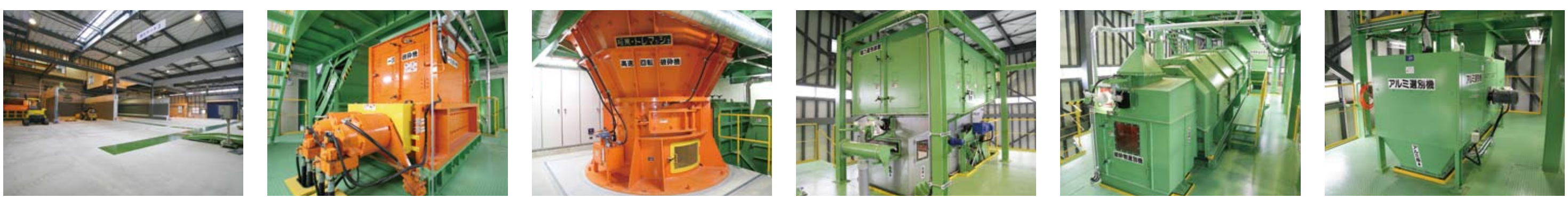
プラットホーム 搬入されたごみをここからそれぞれのラインへ送ります。 一次破砕機 ゆっくりと回転する刃でごみを大まかに破砕し、その後の処理をスムーズにします。 高速回転破砕機 高速で回転する二次破砕機で、たたき・砕き・切断してさらに細かくします。 磁力選別装置 電磁石を使ってごみの中から鉄分を回収します。 破砕物選別機 破砕物の大きさによって、可燃物、アルミが含まれた可燃物、不燃物の3種類に選別します。 アルミ選別機 選別した可燃物からアルミを回収します。