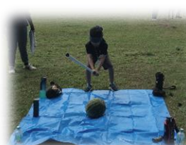
ドキドキわくわく スイカ割り