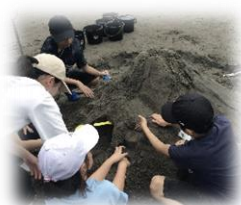
浜辺で力を合わせて サンドアート