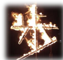
キャンプファイヤーの 火文字「歩」

キャンプの準備会や当日は、多くの保護者や学校、関係機関の皆様にご参加いただき、児童生徒にとって大きな励みとなりました。ありがとうございました。