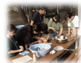
野外炊飯 協力してカレー作り

市立学校に通う小学4年生から中学3年生までの不登校及び不登校傾向にある児童生徒を対象とした一宮ふれあいキャンプが、2泊3日の日程で実施されました。当日は、児童生徒21名（小学生10名、中学生11名）が参加しました。