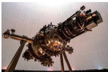
ある日のプラネタリウム コスモくん

2023年はドイツでプラネタリウムが発明され、初めて公開されてから100年の節目の年にあたります。国際プラネタリウム協会(IPS)や日本プラネタリウム協議会(JPA)では今年10月から2年間で100周年の期間と位置づけ、様々なイベントを計画しています。