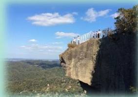
6月 鋸山ハイキング