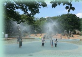
7月 アンデルセン公園