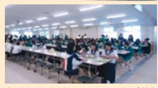
広くきれいになったランチルームでは、全校生徒1106人がゆったり座って食事ができます。