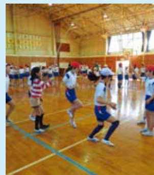
体力向上の取り組み