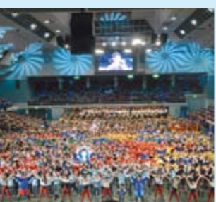
千人の音楽祭(アリーナ)

船橋で育つことが子供たち一人一人の心の中で大きな意味を持つように、船橋の歴史、自然や文化などを学ぶ機会を充実させ、故郷である「ふるさと船橋」を誇りに思い、大切にすることを育む教育を推進していきます。