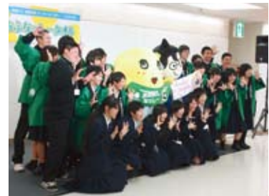
「いちふなっしータオル」の発表会