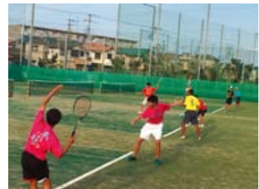
市立船橋高等学校のテニスコート

陸上競技部・男子バレーボール部・女子バレーボール部・体操競技部・男子バスケットボール部・女子バスケットボール部・柔道部・剣道部・ソフトテニス部