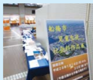
船橋をテーマにした社会科作品の展示会(平成27年度・市役所)