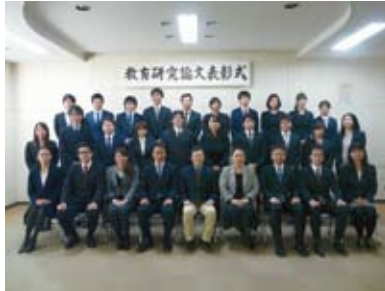
表彰式での集合写真 (平成28年2月16日)