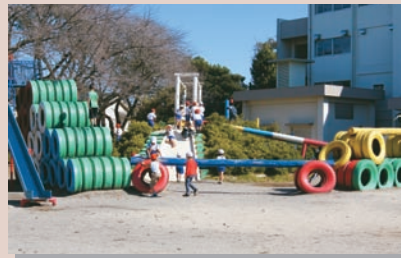
タイヤを使った楽しい遊具