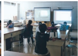
モニタールームで視聴

○発表力審査は、正解を出すだけでなく、問題に含まれた課題を正しく理解し、解き方を相手にわかりやすく説明する力（表現力）をみるためのものです。