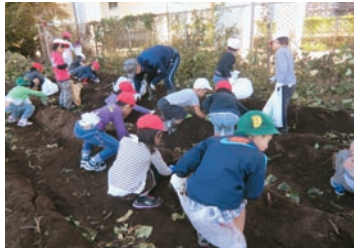
低学年による収穫の様子