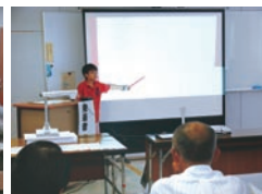
小学校発表力審査