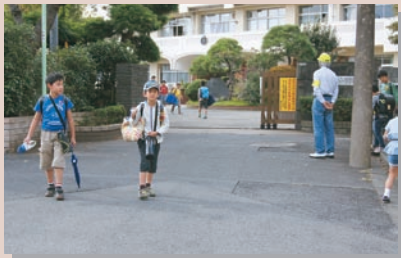
今日もがんばったね、また明日