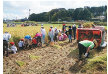
保護者、地域の方と一緒に稲刈り