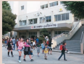
安全に下校しましょう 校門からのアプローチ