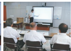
中学校発表力審査