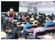
ファーストチャレンジ 小学校筆答

船橋市総合教育センター 〒273-0863 船橋市東町834番地 TEL 047-422-7730 http://www.gec.funabashi.ed.jp/