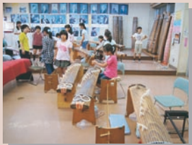
音楽部の練習風景