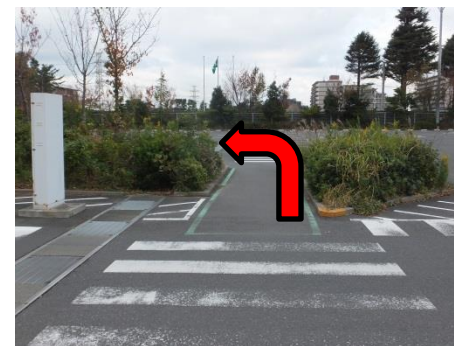
植込みの先を左に曲がり