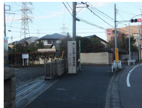
6. ようこそ「とびはく」へ

2~4のかわりに ショッピングモール内を 通っても来館できます。 特に駐車場では 車にご注意ください。