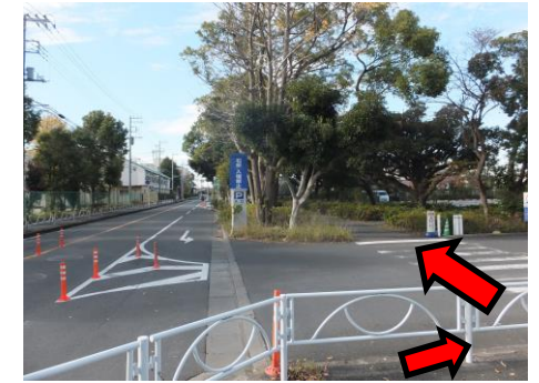
4. 出入りする車に気を付けて