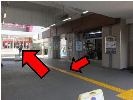
1. 改札(1箇所)を出て右(西口)