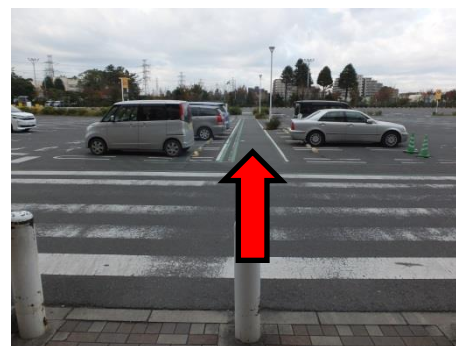
駐車場をまっすぐ進んで