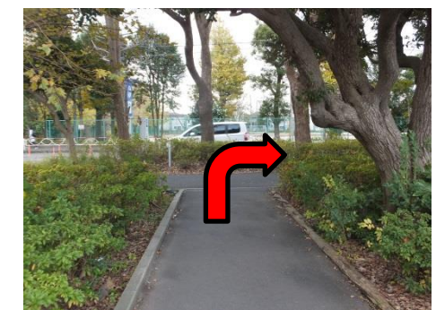
突き当りを右で「5」の信号です