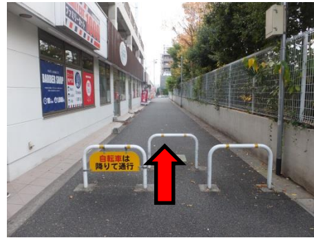
2. 左手に高架を見て進みます