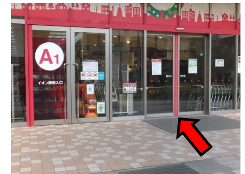
「A1」を入れて店内を直進

2~4のかわりに ショッピングモール内を 通っても来館できます。 特に駐車場では 車にご注意ください。