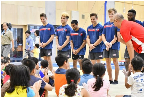
《アメリカ男子体操チームの体操体験会》

昨年に引き続き、アメリカ男子体操チームの事前合宿を受け入れ、市民交流イベントとして一般公開や体操体験会を実施します。また、障害者スポーツの普及・啓発を図るため、小学校におけるパラスポーツ体験授業や特別支援学校と特別支援学級の児童・生徒を対象とするサッカー教室を開催するほか、スポーツ推進委員に対し、初級障がい者スポーツ指導員養成講習会の受講料を助成します。