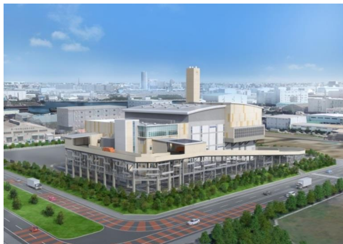
《南部清掃工場の完成イメージ》

※DBO（Design Build Operate）方式：公共が資金調達を行い、設計・建設・運営を一括して民間に発注する方式。