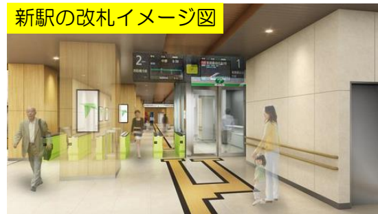
新駅の改札イメージ図

現在海老川上流地区において、医療サービスの充実と健康に寄与するまちづくりをテーマとした「ふなばしメディカルタウン構想」に基づき、新たなまちづくりの核となる新駅の工事を進めています。