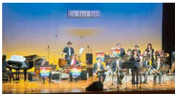
ビッグバンド・バグス