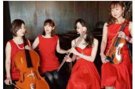
Cinema Trip Lovers