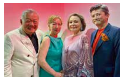
ハレルヤシンガーズ