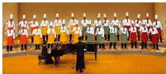
塚田のcockさん合唱団