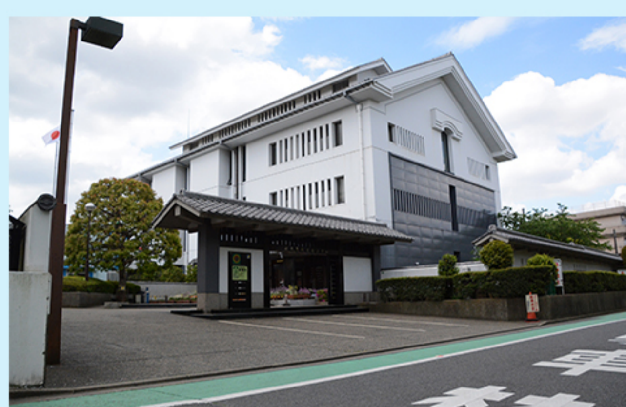
J 武道センター (市場1-3-1)