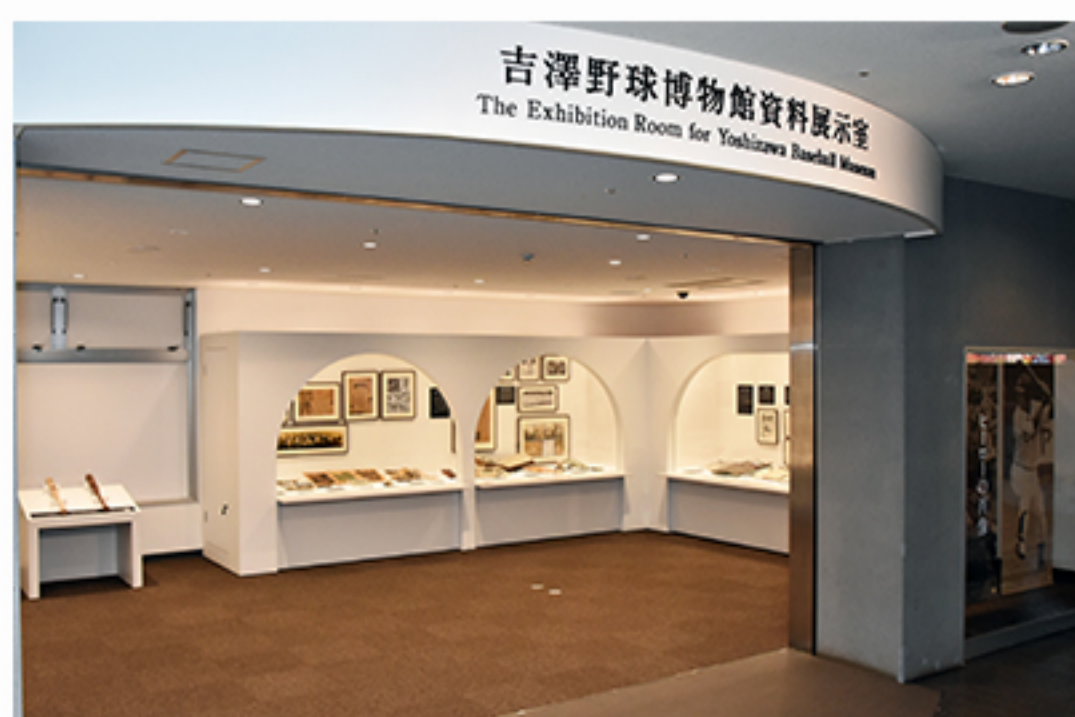
スポーツ資料展示室（船橋アリーナ内）

プロバスケットチーム「千葉ジェッツふなばし」のホームアリーナでもある船橋アリーナ。ここには、市ゆかりのアスリートなどのスポーツ資料のほか、日本野球史を知ることのできる貴重な資料が展示されており、NHK『いだてん〜オリンピック囃〜』で取り上げられました。