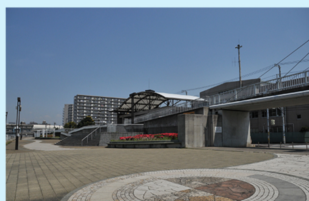
N 船橋港親水公園 (浜町2)