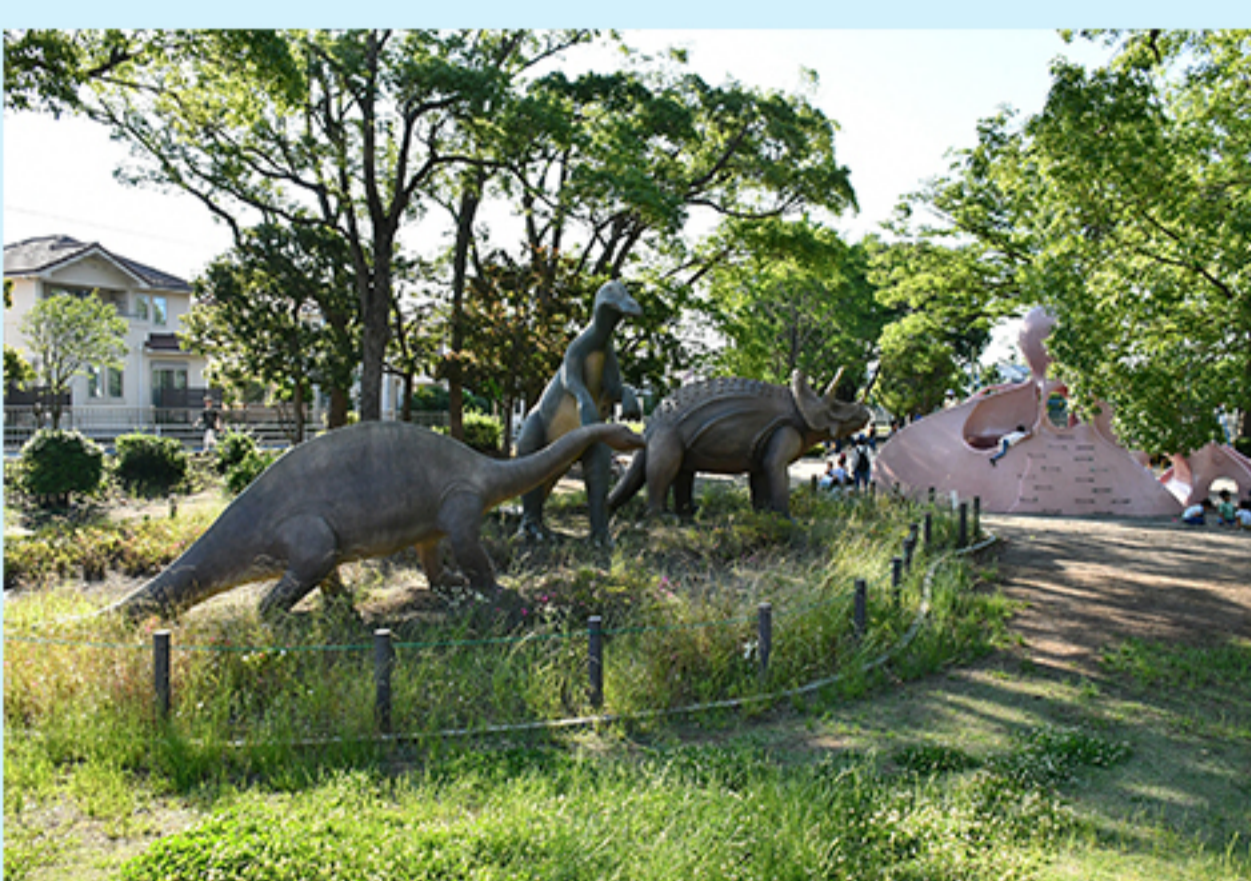
D 高根木戸第3号公園 (高根台3-1)