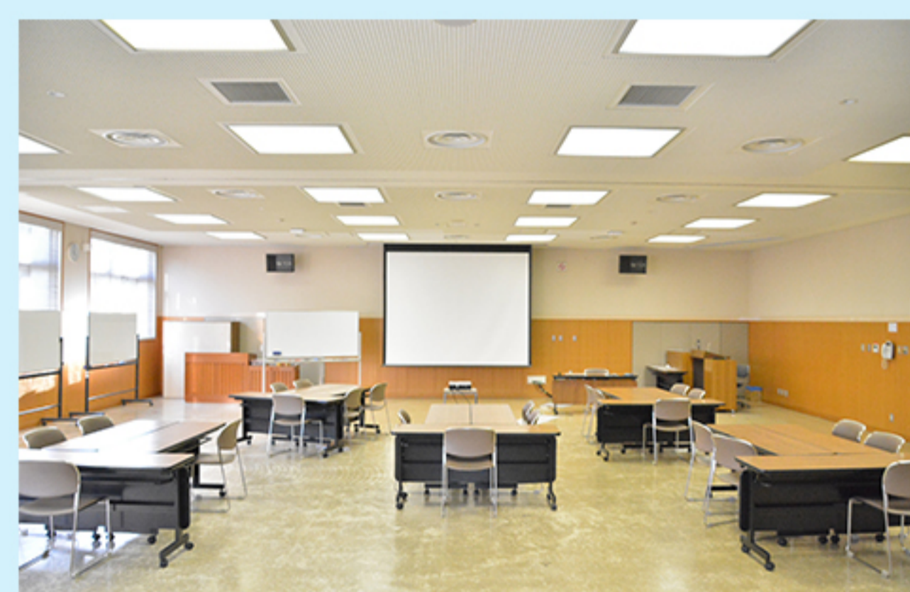
L 職員研修所 (湊町2-6-10)