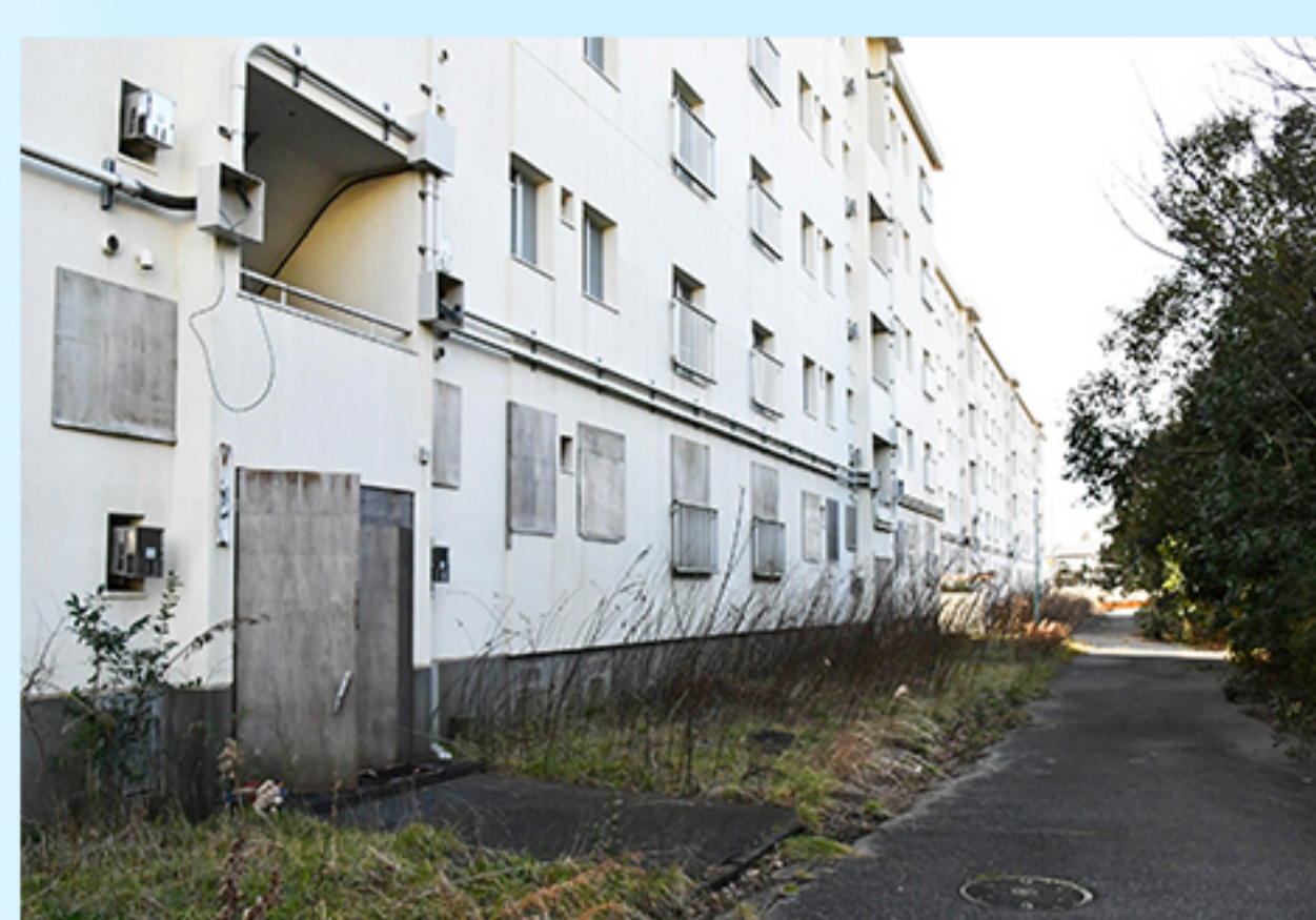
F 船橋行田住宅跡地 (行田3-15-4)