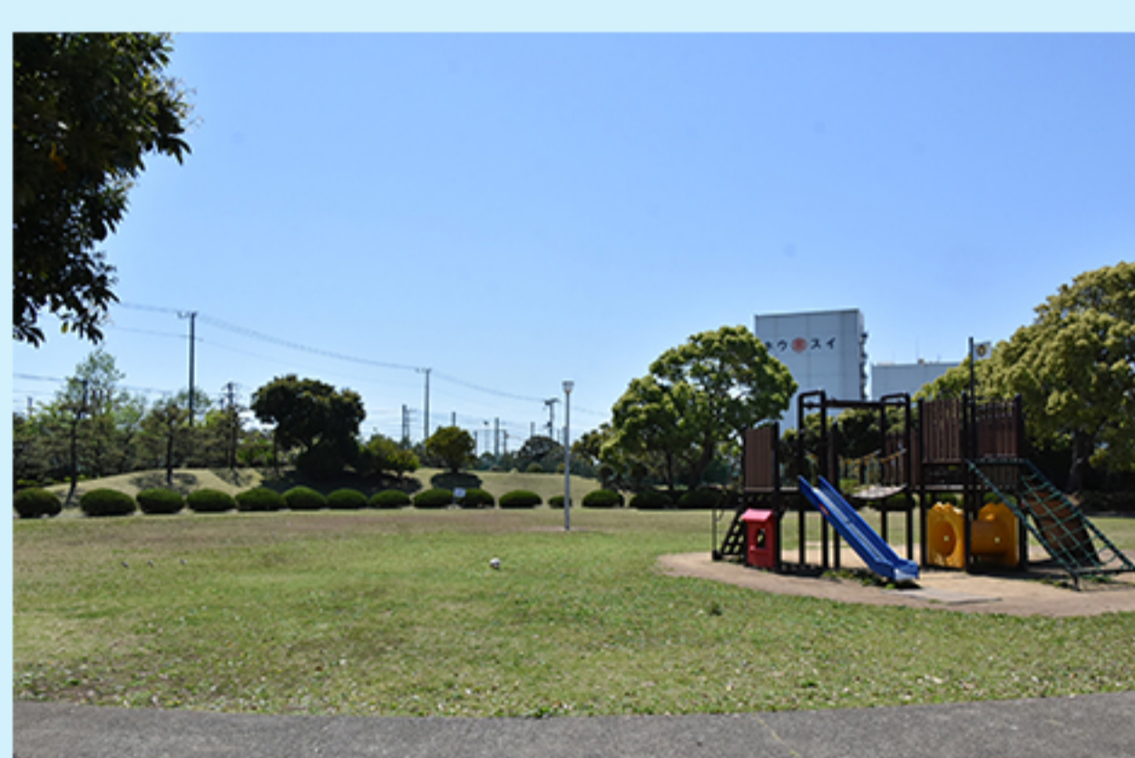
O 若松公園 (若松3-4-1)