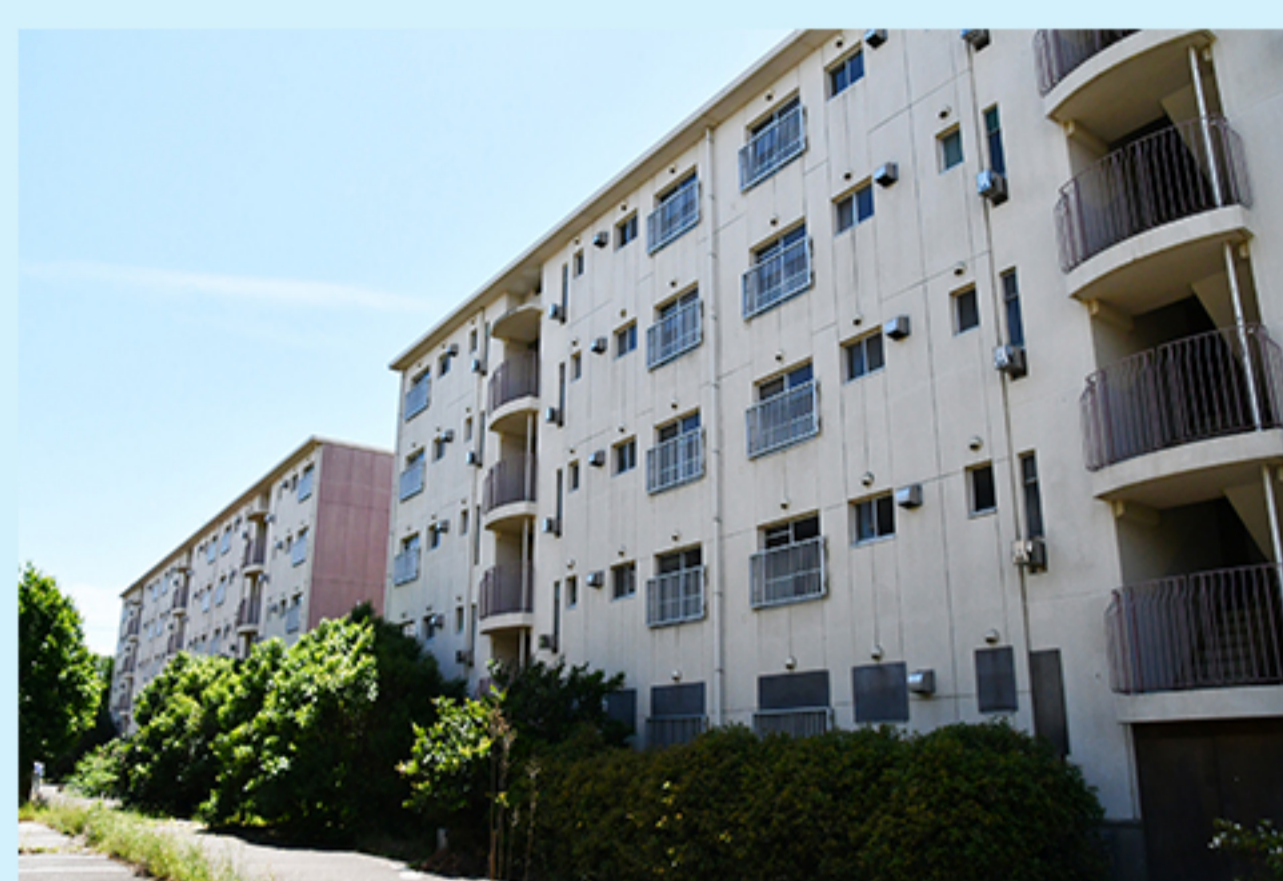
B 旧国家公務員住宅二和宿舍 (二和東5-101-3)