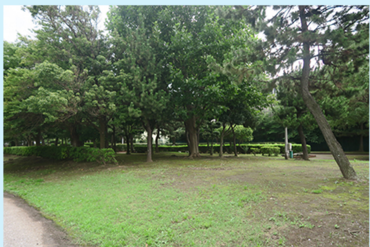
P 高瀬町緑地 (高瀬町66)