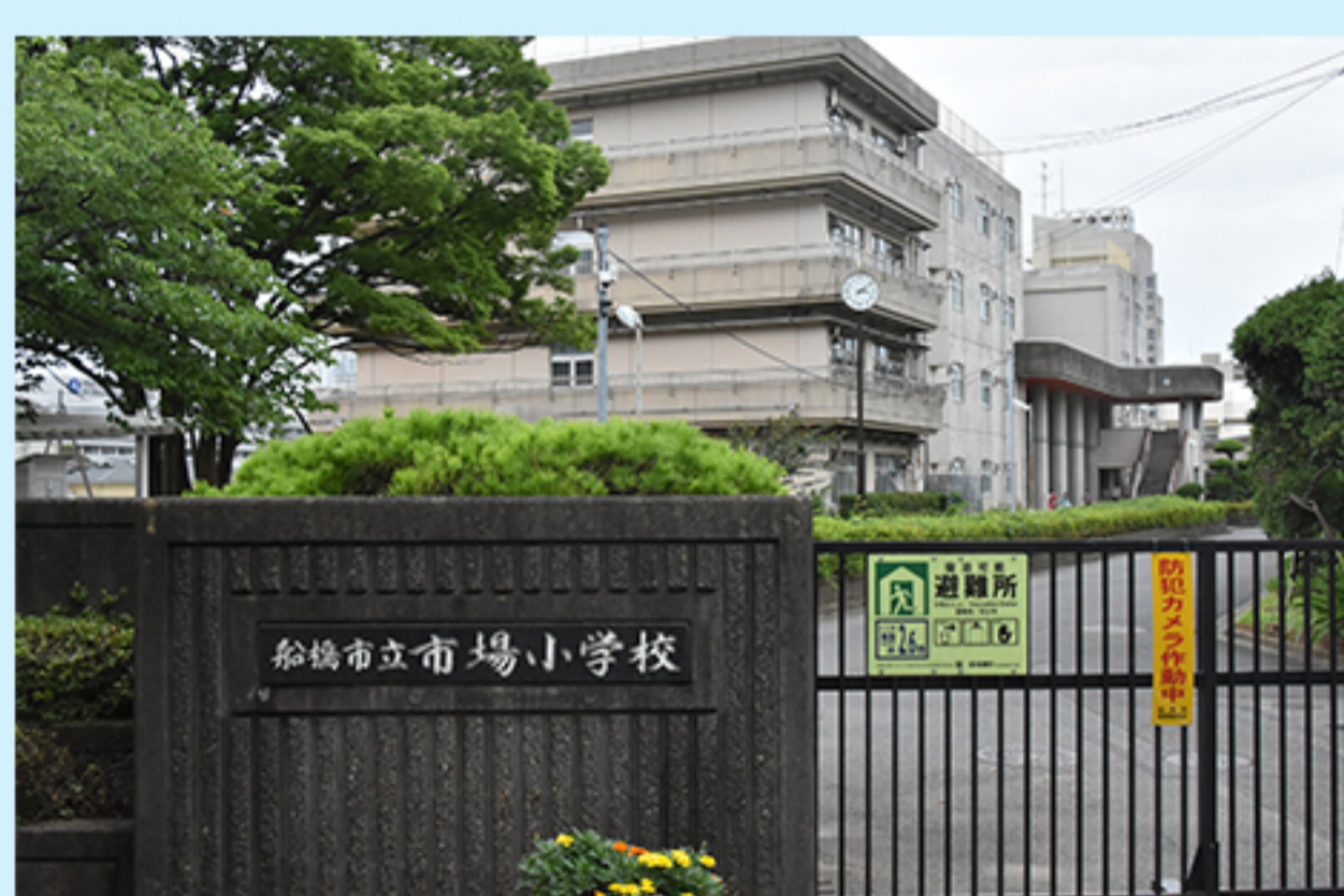
I 市場小学校 (市場1-5-1)