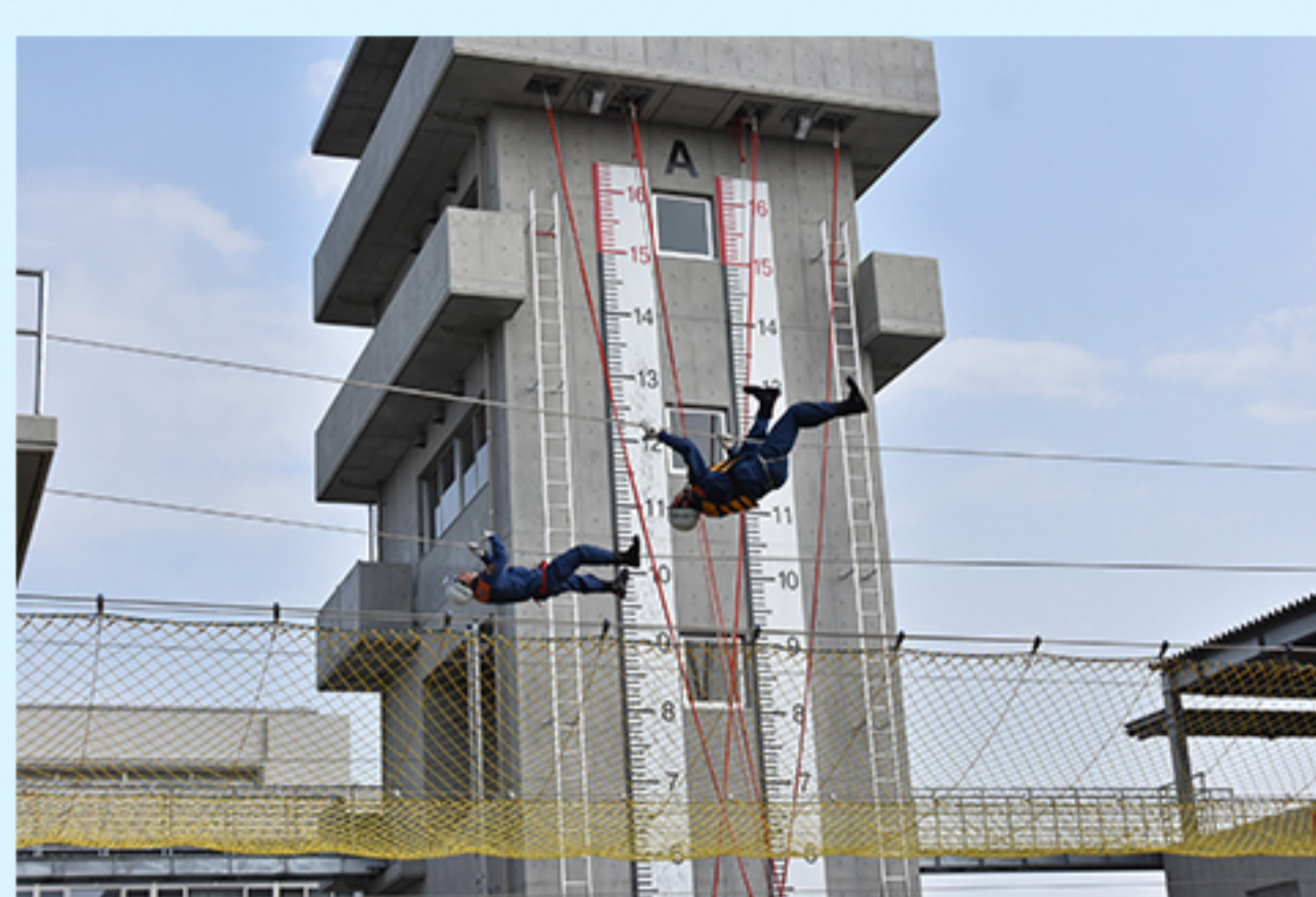
C 消防訓練センター (古和釜町502-1)