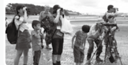
過去の観察ワークショップ

対象: どなたでも (小学4年生以下は保護者同伴) 参加費: 500円/個 定員: 各回先着8組 (各回開始30分前に整理券配布)