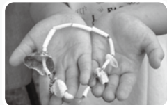
三番瀬の貝がらで工作体験