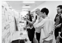
過去のパネル展示