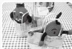
新聞紙で作るバッグ