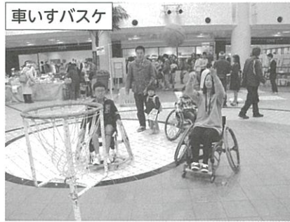
車いすバスケット