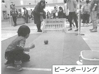
ビーンボーリング