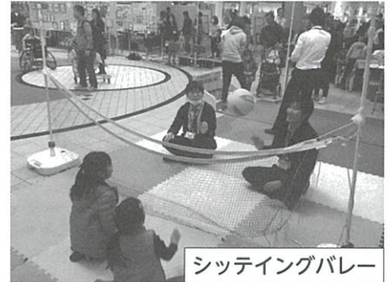
シッティングバレー