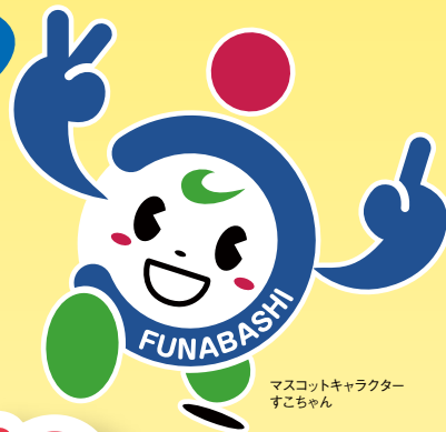
マスコットキャラクター ずこちゃん