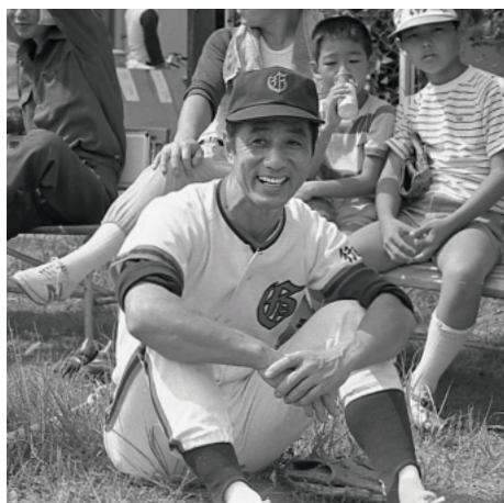
塚田地区町会のソフトボール大会にて【昭和59年】