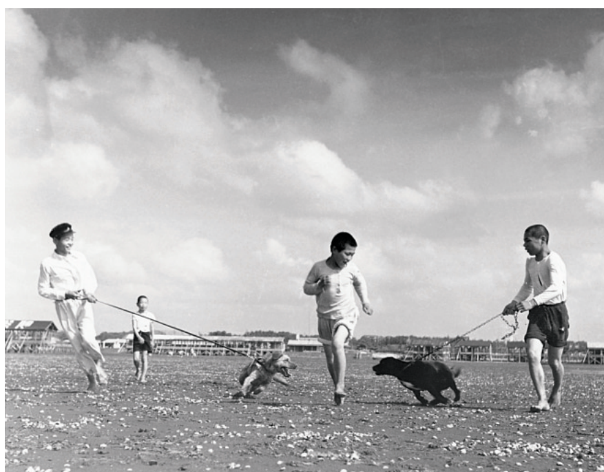
船橋海岸で犬の散歩をする少年たち【昭和28年】