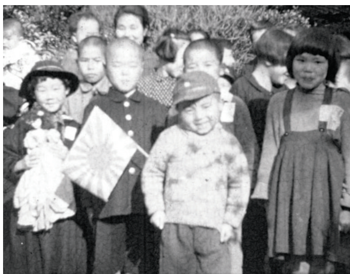
戦時中の子どもたち【昭和18年】