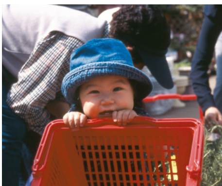
『緑と花のジャンボ市』の会場にて【平成10年】