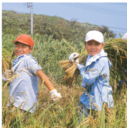
稲刈り体験教室【平成13年】