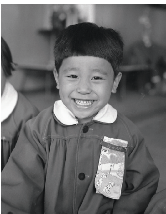
保育園に五月人形が飾られたことを喜ぶ園児【昭和39年】