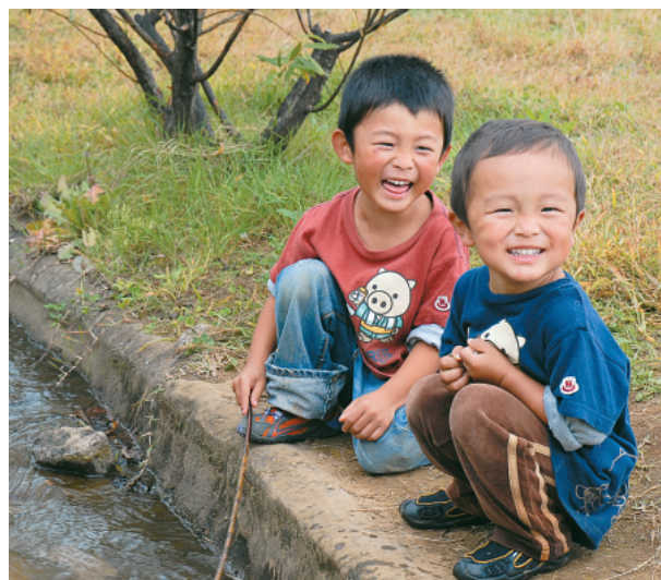
アンデルセン公園で無邪気にはしゃぐ男の子たち【平成18年】