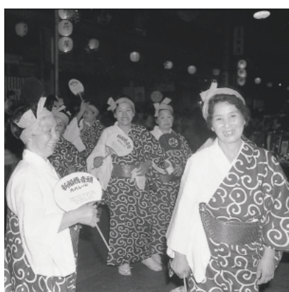
産業まつり【昭和44年】