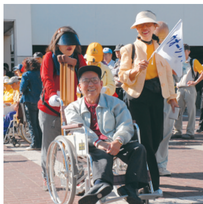
市民ウォークラリー【平成18年】