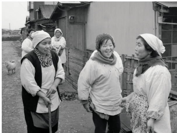
清掃活動中にひと息つく婦人たち【昭和39年】