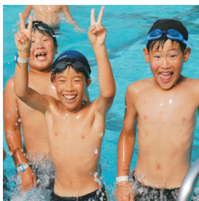
運動公園プール【平成18年】