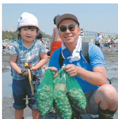
海浜公園の潮干狩り【平成19年】