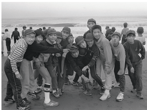
一宮少年自然の家で行われた校外学習【昭和60年】