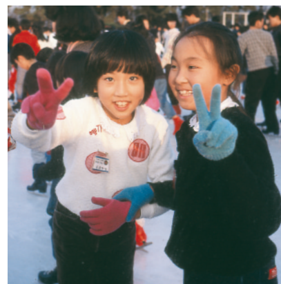
市民スケートリンク【昭和61年】