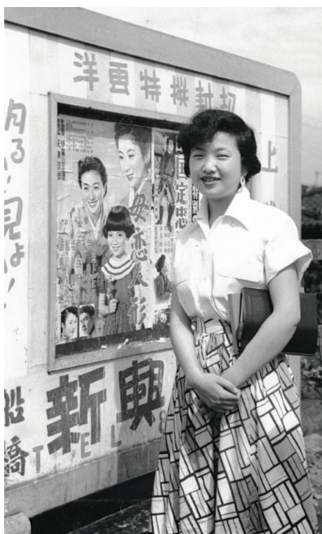
大神宮下駅前にて【昭和29年】