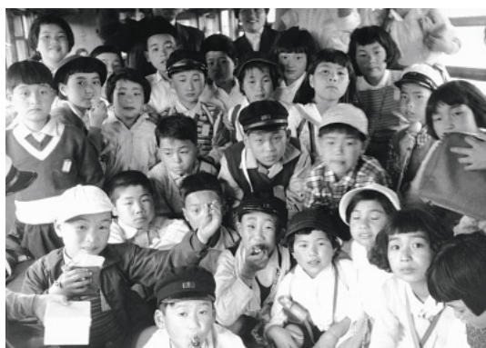
二宮小学校の遠足にて【昭和34年】