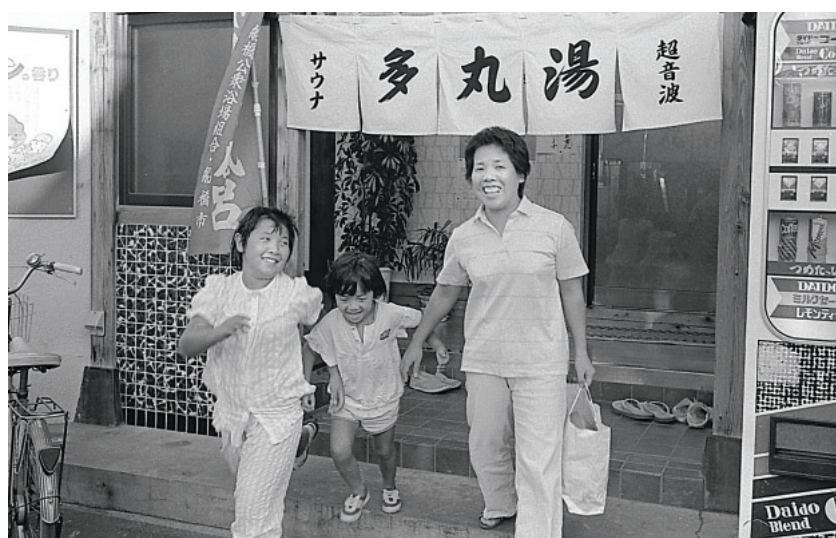
家族で銭湯【昭和60年】