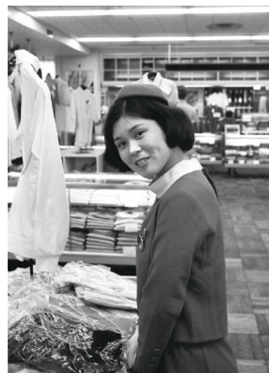
西武百貨店の店員【昭和44年】