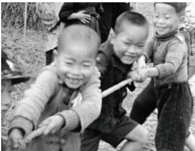
空き地で綱引きをして遊ぶ男の子たち【昭和18年】