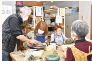
◀クラブ活動の様子