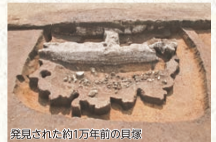
発見された約1万年前の貝塚