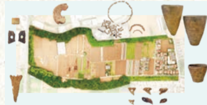
▲上空から見下ろした取掛西貝塚

飯山満町1丁目から米ヶ崎町にまたがる取掛西貝塚は、全国の遺跡の中で、日本の歴史を知るために欠かせない重要な遺跡であると認められ、3年10月に市内初の国史跡に指定されました。