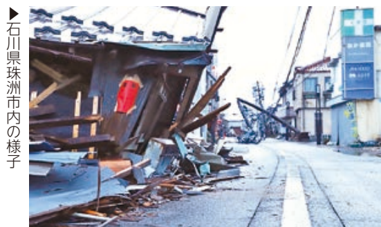
石川県珠洲市内の様子