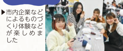
▶市内企業などによるものづくり体験などが楽しめました