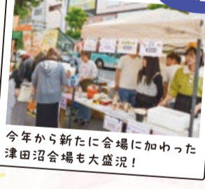
今年から新たに会場に加わった津田沼会場も大盛況!