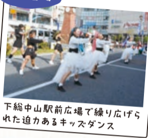
下総中山駅前広場で繰り広げられた迫力あるキッズダンス