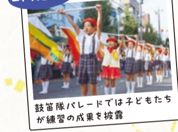
鼓笛隊パレードでは子どもたちが練習の成果を披露