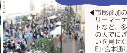
◀市民参加のフリーマーケットなど、多くの人でにぎわいを見せた本町・宮本通り