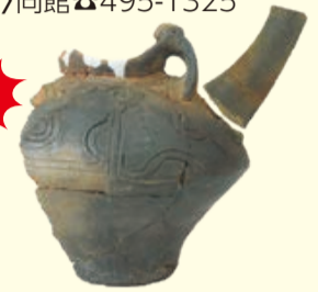
▲まるでやかんのような注ぎ口のついた縄文土器で注口土器と呼ばれます