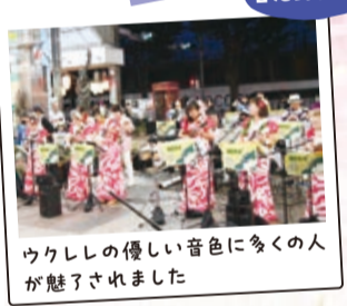
ウクレレの優しい音色に多くの人が魅了されました