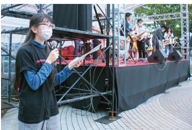
▶ライブパフォーマンスの会を行うボランティア