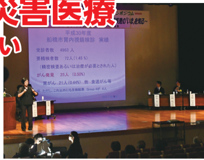
▲前回のシンポジウムの様子

今回の救急医療シンポジウムでは、船橋市における災害時の医療体制について、市民の皆さんと共に学び、考えていきます。