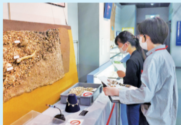
▲飛ノ台史跡公園博物館で展示されている出土品

今、船橋市では、取掛西貝塚をどのように公開していくかを考えているそうです。大切な遺跡を未来へ残していくためにも、私たちのような若者ももっと興味を持って、次の世代の人たちに伝えていくことが大事だと実感しました。