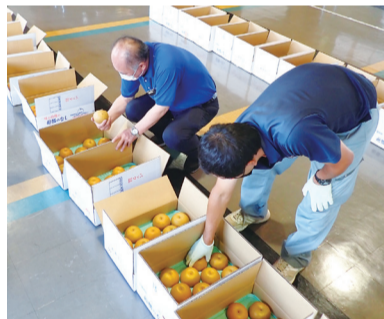
▲一つずつ入念にチェックする外観審査

毎年、皆さんに「船橋のなし」のおいしさを知ってもらうため「船橋市なし味自慢コンテスト」を開催しています。今年は8月下旬に市内の梨生産者99軒から、旬を迎える「豊水」が出品され、糖度・外観・食味の3項目による審査を行い、順位を決定します。受賞した梨は、8月26日(土)、27日(日)に東武百貨店船橋店(本町7)で展示されます。