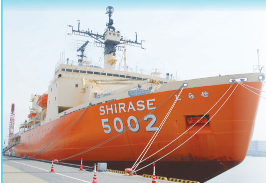
▲京葉食品コンビナート南岸壁(高瀬町2)に係留しています

南極観測船SHIRASE5002は、南極大陸で調査研究を行う拠点となる昭和基地の設備まわりや住環境を整備するため、建造されました。厚さ1.5メートルの氷で囲まれた南極大陸を、実に25回往復し、歴代の南極観測船の中で最多を誇ります。