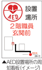
▲AED設置場所の周知看板(イメージ)

市内全公立学校に設置されているAEDを屋外へ移設 市内の全公立学校の校内に設置されている全てのAEDは、これまで職員室や教室など校舎内に設置されてきました。学校職員の不在時でも皆さんが使用できるように、職員玄関や昇降口脇など、屋外の収納ボックスへ8月から順次移設します。