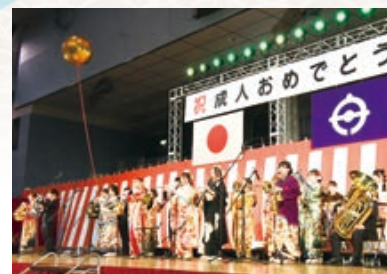
▲今年の二十歳のアピールの様子

〈日程〉6年1月8日(祝) 〈会場〉船橋アリーナ 〈対象〉平成15年4月2日～16年4月1日に生まれた人 ※対象者には10月中旬ごろに案内状を発送