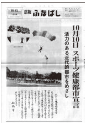
▲「広報ふなばし」昭和58年10月15日号1面

今年、市が「スポーツ健康都市宣言」を行って40周年の記念の年です。船橋市は、市民同士の交流が活発で、各地域での市民の皆さんの活動は、船橋のまちづくりにおいて、なくてはならない力となっています。こうした「市民力」で発展してきた船橋市ですが、昭和30年代後半から多くの団地が造成され、人口が急増したため、市民相互の交流が難しく、まちづくりの大きな課題となっていました。この課題を解決し、「人」も「まち」も健康でありたいとの願いを込め、昭和58年10月10日に「スポーツ健康都市宣言」を行いました。