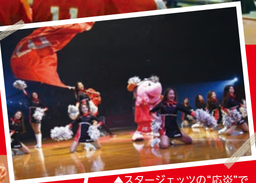
▲スタージェッツの“声炎”で会場がさらに盛り上がる