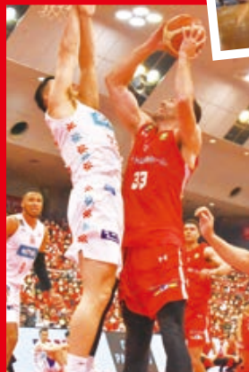
▶ゴール下で激しい戦いを繰り広げるムーニー選手