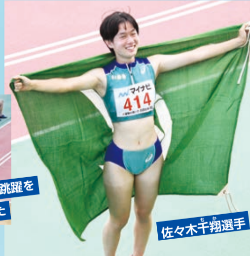
12m45の跳躍を 見せました