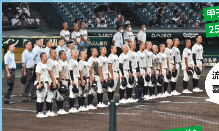
甲子園での勝利は 25年ぶり