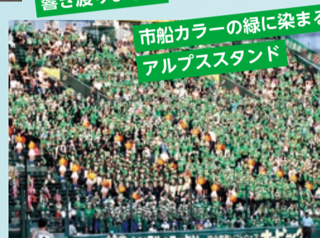
市船カラーの緑に染まる アルプススタンド