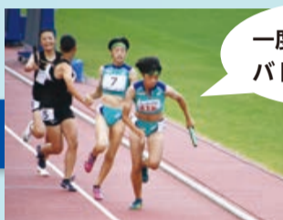
一度も先頭を譲ることなく バトンをつなぎました