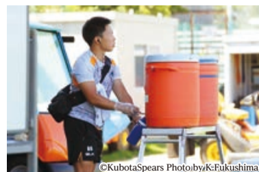
▶選手たちがいつでも水分補給ができる状況をトレーナー陣がサポート

8月は、熱中症警戒アラートが発表される猛暑のなかでも、走り込みなどの基礎体力作りを中心とした猛練習が行われました。こまめな水分補給はもちろん、練習中のアイスタオルやアイススラリー(体の内部から冷却効果を狙ったシャーベット状の飲み物)、練習後のアイスバス(氷風呂)などで熱中症を予防しています。選手たちの体力、体調を管理するコーチの練習強度のコントロール、これまでの選手生活で鍛え上げられた選手たちの身体能力があるからこそ、こうした夏場でも練習が行えます。いい練習はいい準備から!開幕が楽しみです。