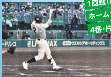
1回戦(8回裏)でレフトスタンドへ ホームランを打った 4番・片野優羽選手