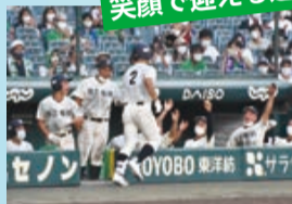
笑顔で迎える選手たち