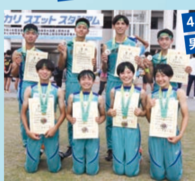
4×100mリレーは 男女ともに2位!