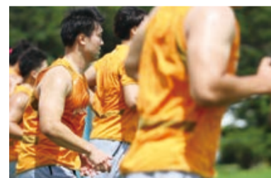
▶若手選手たちを中心に練習に励んでいます

いよいよ本格的なチーム活動がスタートするクボタスピアーズ船橋・東京ベイ。今年12月に開幕予定の「NTTジャパンラグビー リーグワン2022-23」をディビジョン1で戦うことが決定しました。チームの本格的なスタートを前に、一部の選手はすでに練習を始め、早くもレギュラー争いが熾烈をきわめています。