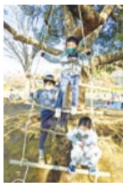
▲団体スタッフと作ったはしごで遊ぶ子どもたち

市民活動団体が5年度に行う事業のうち、公益性や必要性があるとされた事業に対して支援金を交付する「市民公益活動公募型支援事業」の募集を行います。本年度は、医療者による子育てイベントや地域のリレーマラソン、地球温暖化の防止に資する事業等に対して支援金を交付する予定です。