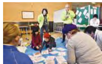
▲ゲームを交えながら活動を紹介

ふなばし健康ポイントの景品抽選応募(すこちゃん手帳の提出含む)は1月31日(金)まで