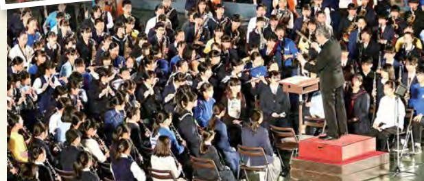
▲演奏者だけでも500人を超えるプラスバンド