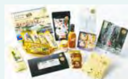
▲船橋の「おいしい新定番」をご賞味ください!

〈日時〉 1月16日(木)～21日(火)午前10時～午後7時30分※最終日は午後6時まで 〈会場〉 東武百貨店船橋店6階イベントプラザ(本町7) ◆同日、同会場 でヘルシー船橋フェアを開催。詳しくは7面へ。