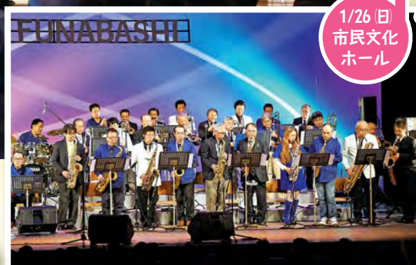
1/26(日) 市民文化ホール