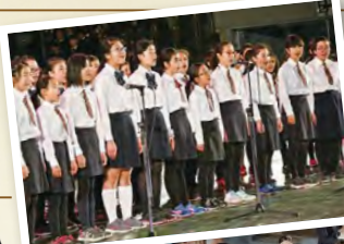
◀会場に響き渡る小学生たちのハーモニー

総勢2000人を超える出演者が一堂に会する圧巻のステージをお届けします。今年さらには、千人の音楽祭のために期間限定で結成された「船橋リミテッドウインドオーケストラ」が会場を盛り上げます。会場の感動をご自宅のテレビやスマートフォンでお楽しみいただけます。