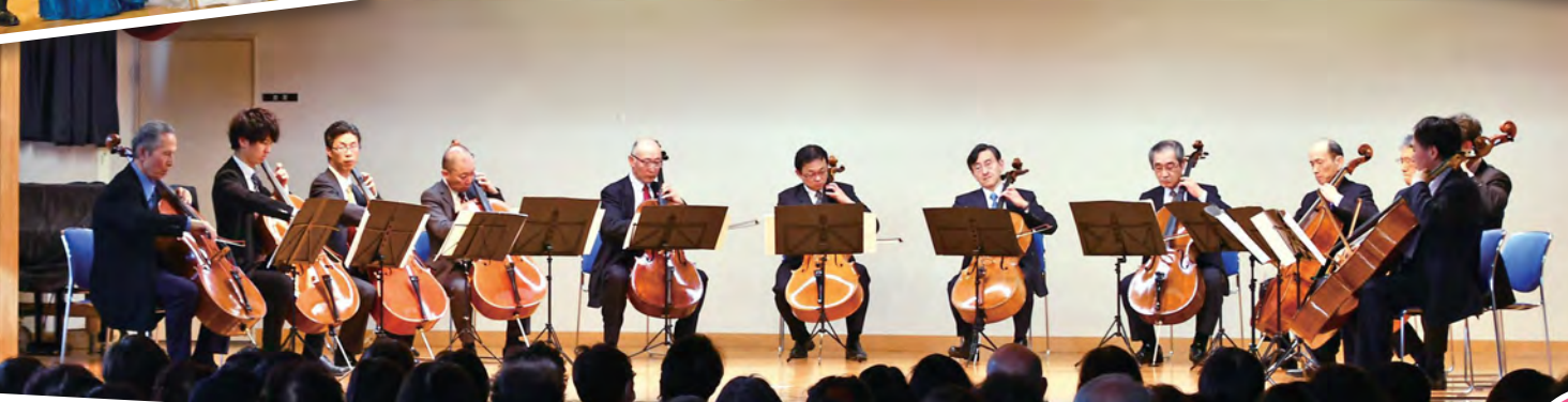
12人のチェロアンサンブルに魅了されました (昨年の松が丘公民館)