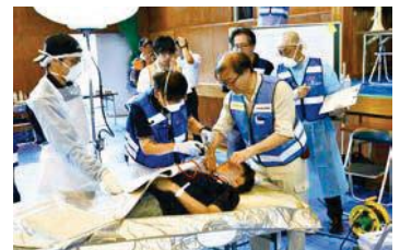
▲多数遺体取扱訓練では遺体安置所の開設から遺体の受け付け、検視等を経て引き渡しまでを行いました(8月25日、看護専門学校で)