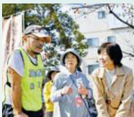
▲民生委員や介護施設職員が高齢者役を担い、声掛け体験を行います