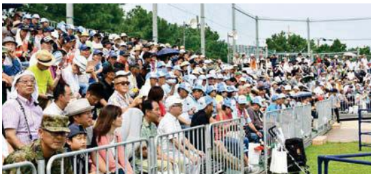
▲スタンドでは多くの市民が緊迫した訓練の様子を間近で見学