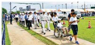
▲会場周辺の若松中の生徒をはじめ、近隣企業が参加した集団避難訓練