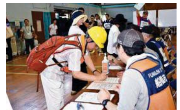
▲避難所運営訓練では、受け付けの流れや機材の組み立て方などを確認(8月25日、船橋中学校で)