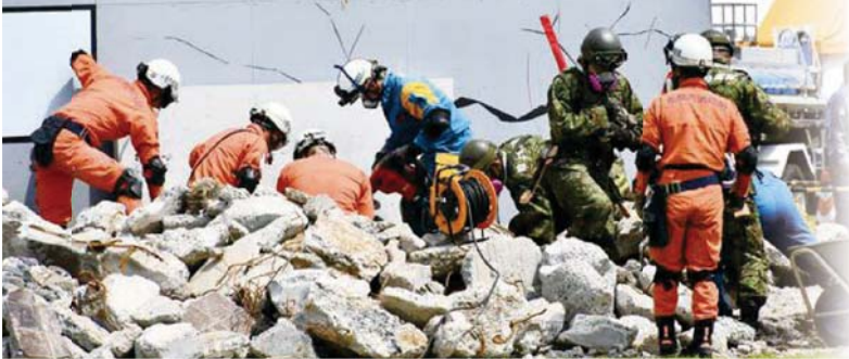
▲警察、消防、自衛隊などが参加して、仮設の被災現場でがれきの中、救助活動を行いました