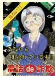
▲高校生の目線でイメージしたイラストは一目見てインパクトがあり、緊迫感・恐怖心を印象づけるデザインになっています

が3億円を超えていて、件数も多いです。皆さんのような若い人が関心を持つことは予防の力になります」と話しました。今後は敬老会等での配布や公民館など公共施設に掲示します。