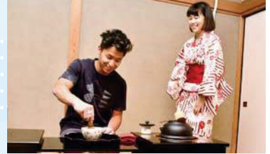
▲茶道体験では市船茶道部が浴衣でお出迎えしました。選手全員が茶菓子と抹茶を堪能した後、代表してユル・モルダウアー選手がお点前を体験

スズキ選手が日本にいたことや生まれた場所など、いろいろな話を聞きました。オリンピックでも活躍してほしいです