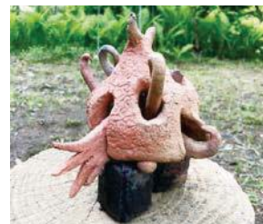
▲「土粘土でオモシロ建築」の作品。ワークショップは夏休みの自由研究にもぴったりです

※全て事前に同館へ申し込み(先着順)。各午後1時30分～3時30分※★印は午前9時30分～午後2時、●印は午前10時～正午および午後2時～4時。対象・定員等はお問い合わせください