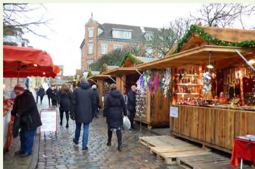
▲会場では北欧デザインの木造売店「ヒュッテ」が並びます(イメージ)

当日、メアリー皇太子妃はデンマーク製玩具などを整備した新エリアの落成式に参加されるほか、北欧フェア会場などを見学されます。皆さんと一緒に、記念すべき節目の年をお祝いしませんか。