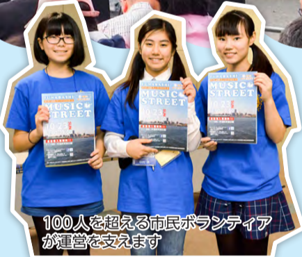
100人を超える市民ボランティア が運営を支えます

“音楽でまちを元気に!”を合言葉に、多彩なジャンルの音楽がまちのさまざまなところで演奏されるイベント「ふなばしミュージックストリート」を、10月22日(日)に開催します。4回目となる今年は、事前審査を勝ち抜いた105組のミュージシャンや船橋を拠点とするプロミュージシャンが、16会場でポップス、クラシッ