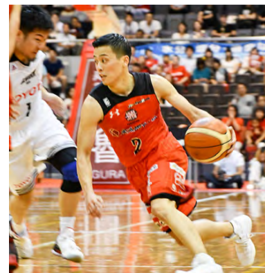
▲決勝で鋭いドリブルを見せた富樫勇樹選手

9月29日に2017-18シーズンが開幕しました。シーズン直前に行われたKANTO EARLY CUPではスピード感のあるプレーで準優勝に輝き、大きな感動を与えてくれました。リーグ戦に向け弾みをつけたジェッツ。Bリーグ初優勝に向けて奮闘するジェッツを皆さんで応援しましょう。