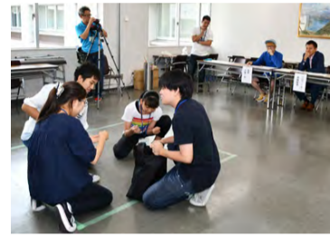
▲市民オーディションでは、台本なしの即興劇で演技力をアピール