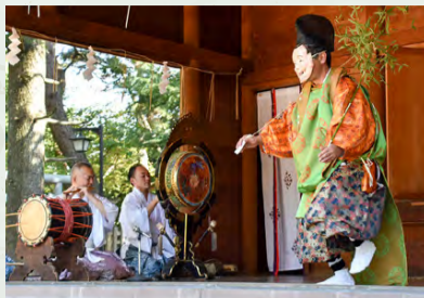
▲神楽の一つ「蛭子舞」。海上安全や豊漁を祈願します