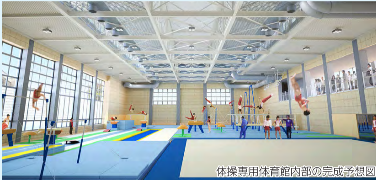
体操専用体育館内部の完成予想図

2020年の東京オリンピックに向けて、アメリカ男子体操チームの事前合宿が船橋市で行われることが決まりました。事前合宿は、平成30年から32(2020)年まで毎年実施する予定です。オリンピックが直接感じられる機会を通じて、子どもたちの夢を育むとともに、市全体で大会を盛り上げていきます。