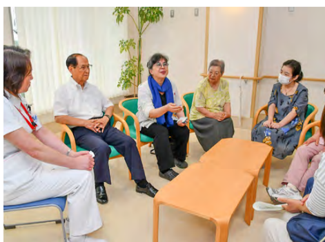
▲がん患者サロンは患者や家族がさまざまな思い、悩みを自由に話せる場です

〈場所〉医療センター 〈対象〉がん患者、家族※同センターを受診していなくても利用できます 〈費用〉無料