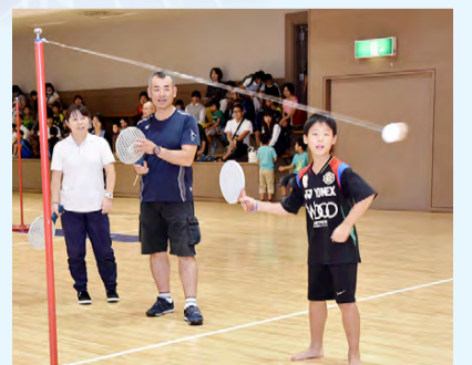
▲「スピードボール」など、いろいろなスポーツを体験してみよう

▶体感・わくわくイベント パトカー・白バイ乗車体験、ニュースポーツ体験、ミニSL、フリーマーケット、野菜直売会ほか