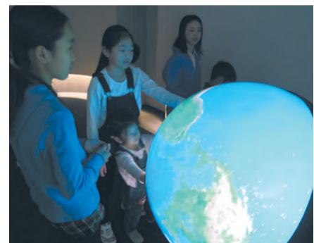
▲地球の温暖化やリアルタイムでの雲の様子などを見ることが出来るデジタル地球儀「触れる地球」

ふなばし三番瀬海浜公園内に、自然環境を楽しく学べる施設「ふなばし三番瀬環境学習館」がオープンしました。7月1日(土)、2日(日)は利用料無料。オープニングイベントを開催します。※イベントの詳細等は同館へお問い合わせください