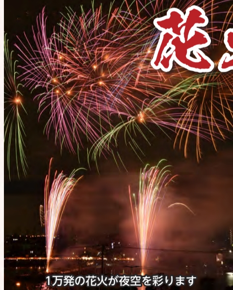
1万発の花火が夜空を彩ります

市制80周年にちなんで、8秒間で800発が打ちあがる大迫力のオープニングや、全長80メートルを光が繋ぐ「ナイアガラ大瀑布」など、特別な花火大会を開催します。