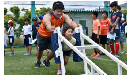
▲スクラムマシンを選手と一緒に体験