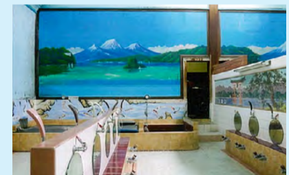
▲宮の湯(宮本らの男湯)

宮の湯には、主にお年寄りの方が来てふれあいの場になっています。ぼくは、日本を感じられる銭湯に外国の方にも来てもらって、素晴らしい文化を感じてほしいなと思いました。