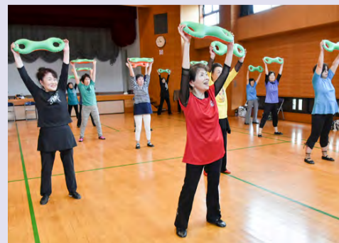
▲Ball(ボール)・Bell(ベル)・Belter(ベルター)を使って行う3B体操。写真はベルを使った体操

「重い荷物が持てない」「近くにお店がない」といった買い物に困っている人に利用してもらおうと、市では宅配サービスを行っている店舗の情報をまとめた「宅配ガイドマップ」を発行しています。 このマップには、日々の生活に必要な食品や日用品等を宅配している店舗について、注文方法や取り扱い品目を見やすく掲載しています。高齢者や子育て中で外出できない人などぜひ活用ください。 〈設置場所〉高齢者福祉課、船橋駅前総合窓口センター(フェイスタビル5階)、各出張所・連絡所等※市ホームページからも取り出せます。郵送を希望する人は同課へお問い合わせください。