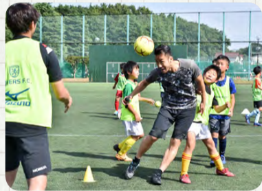
▲ヘディングのお手本を見せる吉田選手

プレミアリーグ「サウサンプトンFC」に所属し、現在日本代表としてW杯最終予選で激闘を続ける吉田麻也選手が、市立船橋高校出身で元ユース日本代表のカレン・ロバート選手らと6月17日にグラスポ(法典公園)で、市内の子どもたち42人に、サッカー教室を行いました。