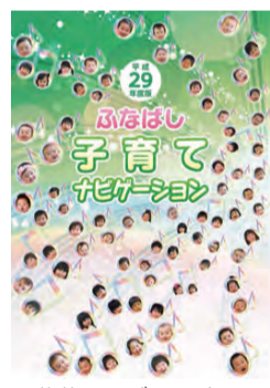
公算のモデル80人の笑顔が掲載された表紙