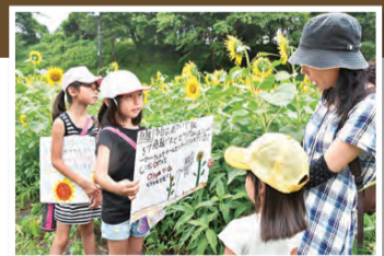
▲巨大迷路の中で児童たちがクイズを出題

金杉小学校の皆さんが市農業士等協会やボランティア団体「ひまわり憩いの広場の会」と協力して育てた約2万本のヒマワリが、7月上旬に見ごろを迎えます。