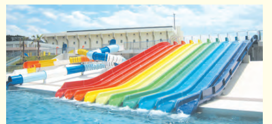
▲ウォータースライダーなど市内小学生へのアンケートで人気のあったアトラクションを設置

※追加使用料は1時間につき使用料の半額。また、終了時刻の90分前以降の入場は、使用料半額