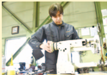
▲全て手作業で組立てています

1970年より、船橋の地で製造・販売されています。海外の有名ブランドバッグや飛行機などの座席まであらゆるモノを縫っています。縫い目の美しさや厚いものでも安定的に縫えることが評価され、厚物用工業ミシンの専門メーカーとして国内シェアナンバーワンです。また、製品の90パーセントは海外に輸出されており、世界数十か国で使われている、まさに「船橋から世界への工業製品です」。