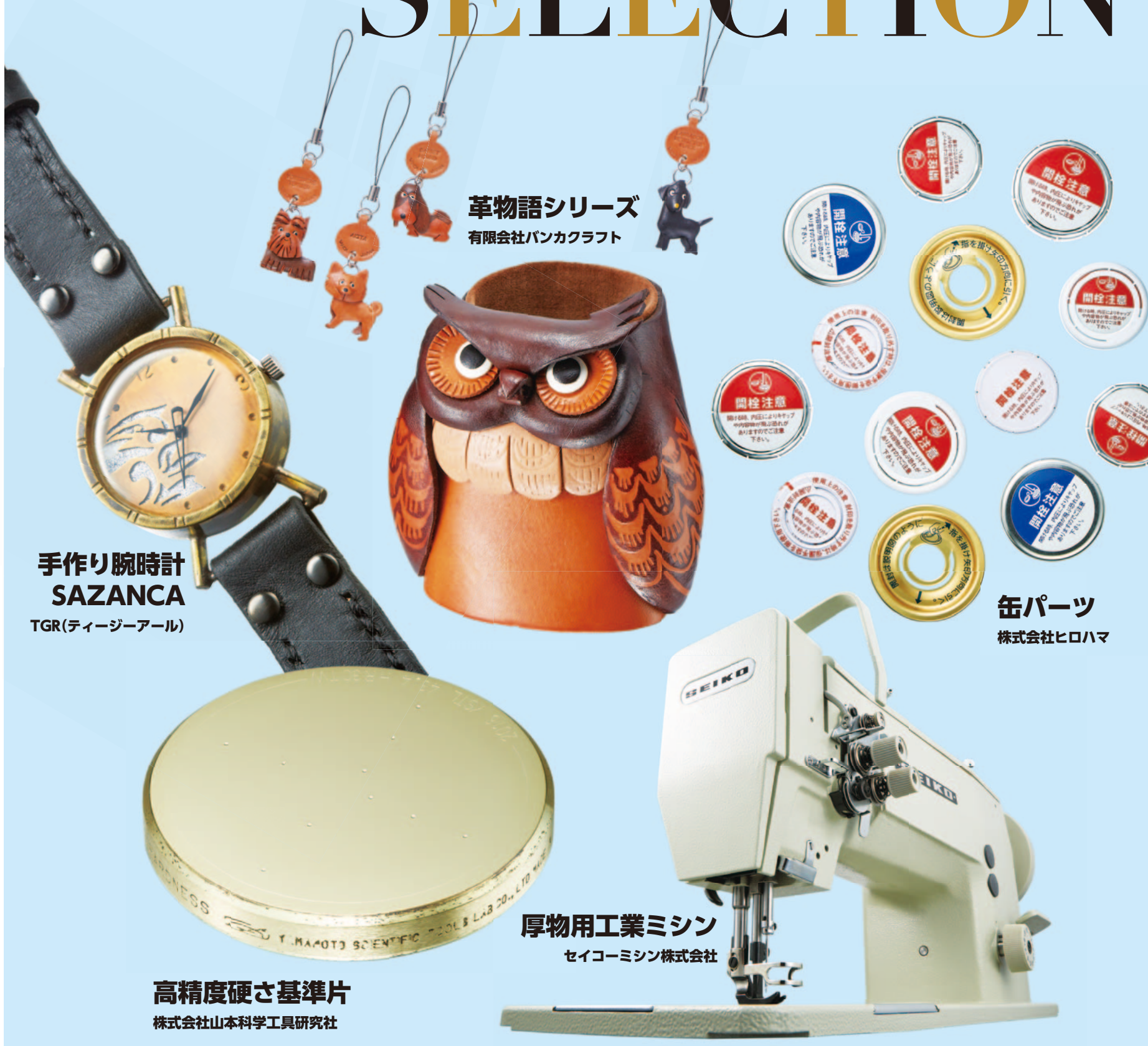
革物語シリーズ 有限会社パンカクラフト