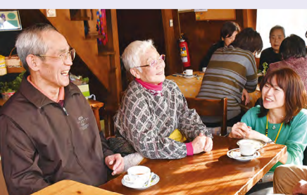
▲お茶を飲みながら、楽しく会話が弾みます(はさまオレンジカフェ)