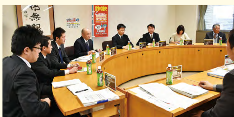
各機関が一堂に会し、具体的な対策を協議しました

第1回の会議では、昨年被害が集中した2~4月の被害軽減を目指し、啓発活動やATMの巡回の強化など、各機関が連携する具体的な対策を決定。今後、この会議は月1回程度開催し、より効果的で実効性の高い電話de詐欺対策の実施を目指します。