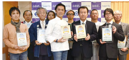
▲1月17日に表彰式を行いました

地域の皆さんに愛される魅力的なお店を発掘し、商店街の賑わいにつなげる「ふなばしお店グランプリ」。今回、独自の魅力を持つ44店舗から応募があり、審査の結果、下記のとおりグランプリと準グランプリが決定しました。今後市では、船橋商工会議所と一体となって、受賞店の積極的なPRをしていきます。みなさんぜひ足を運んでください。