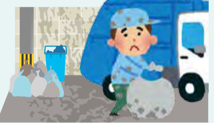
▲収集中に油が飛び散り迷惑となります