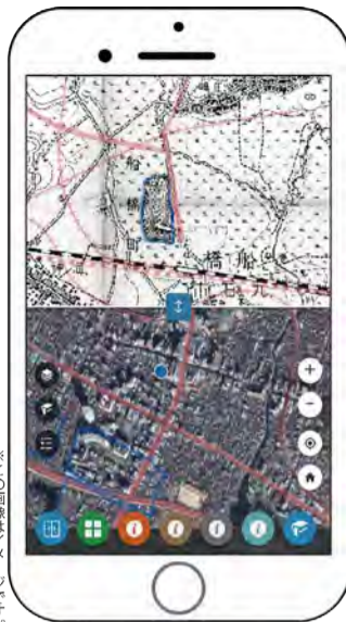
※この画像はイメージです。