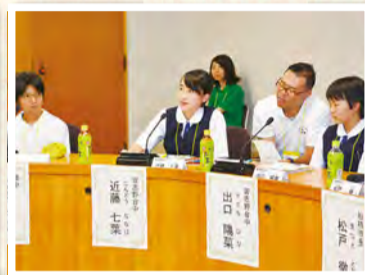
▲各校からはすどい質問も