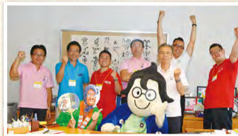
▲企画段階からご協力いただいた市民団体の皆さん