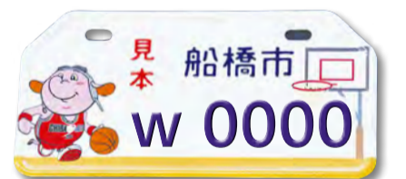
▲ジェッツのマスコットキャラクター「ジャンボくん」が描かれています

◆現在交付中の通常型とオリジナルナンバープレートも引き続き交付します。 ◆記号・番号は選べません。また、ナンバープレートの交換では、現在登録されているものとは異なる番号になります。※番号の変更に伴い、自賠責保険等の変更手続きが必要になる場合があります。詳しくはご加入の保険会社へお問い合わせください