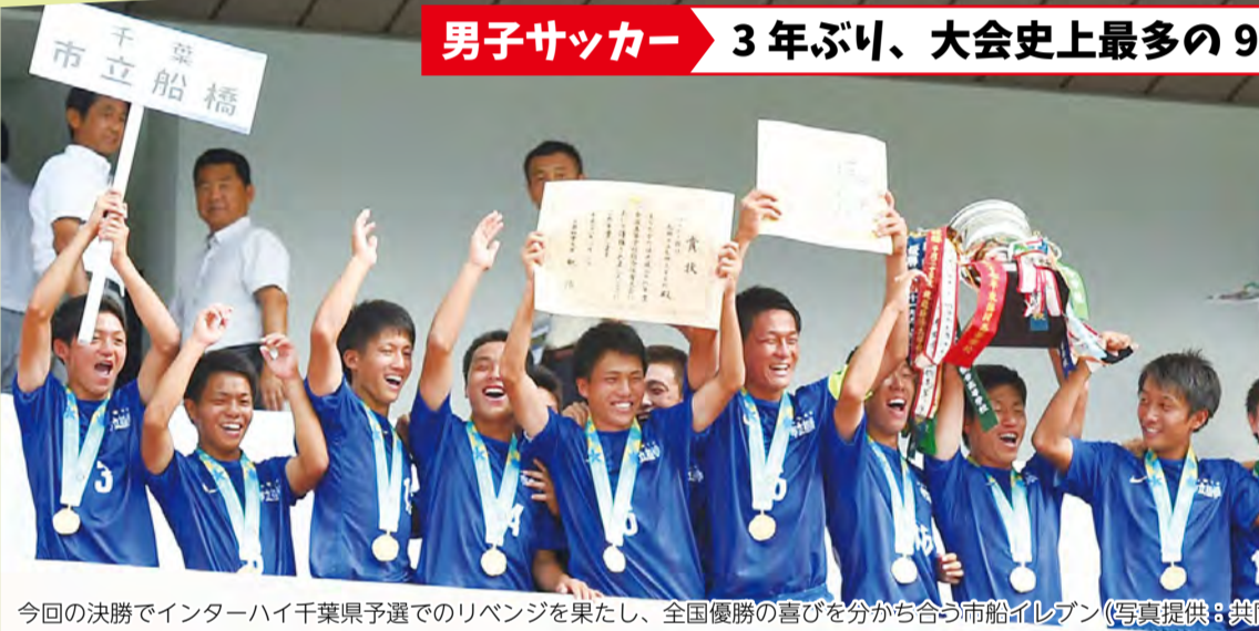
今回の決勝でインターハイ千葉県予選でのリベンジを果たし、全国優勝の喜びを分かち合う市船イレブン