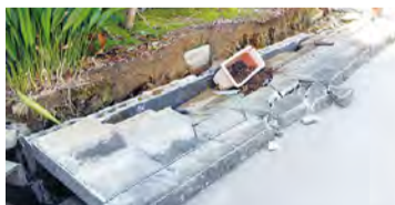
▲地震で倒壊したブロック塀

＜申込み＞ 10月31日(月)までに、事前相談書に必要な書類を添えて同課へ※書類提出後、審査あり