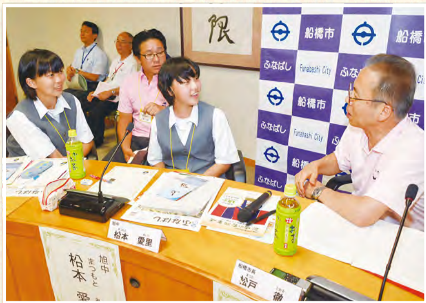
▲和やかな雰囲気の中、さまざまな提案について直接市長と意見交換をしました

市の現状を子どもたちに伝え、まちづくりを意識してもらうとともに、市長と将来を見据えた意見交換を行い、子どもたちの視点を生かした市政運営につなげていくことを目的とした「こども未来会議室」を夏休みの4日間で開催しました。