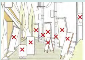
▲公共の場の違反広告物の例

屋外広告物は、情報を伝えるだけでなくまちを活気づける要素となっていますが、無秩序な掲示は景観を損ねたり、倒壊や落下等により人に危害を及ぼす恐れがあります。そのため、ルールを守った掲示をしていただく必要があります。