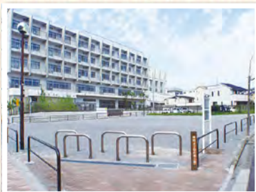
▲試行が行われている本町4丁目広場公園