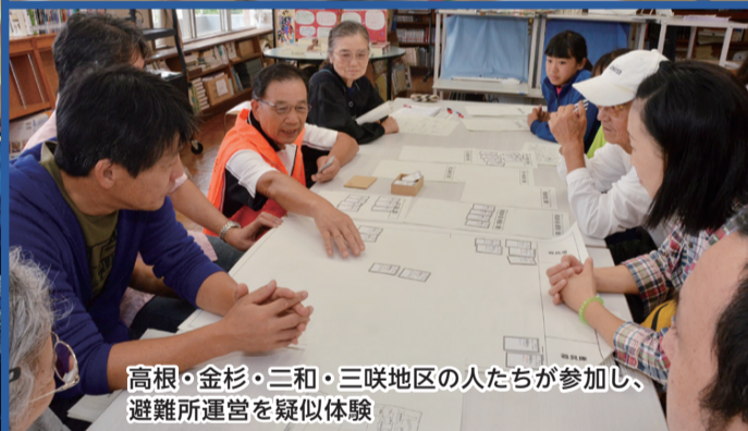
高根・金杉・三和・三咲地区の人たちが参加し、避難所運営を疑似体験