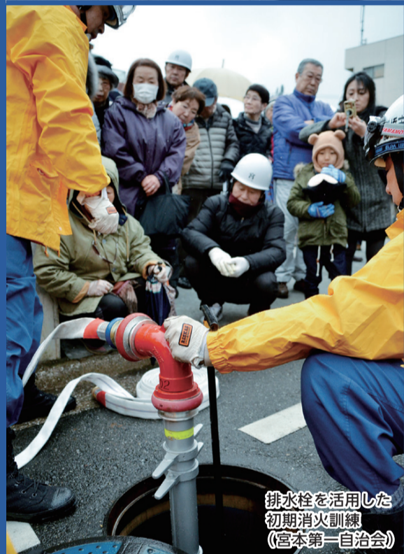
排水栓を活用した初期消火訓練 (宮本第一自治会)