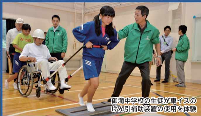
御滝中学校の生徒が車イスのけん引補助装置の使用を体験