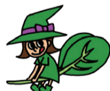
西船なな姫ちゃん

■西船橋小松菜祭りも開催 5月29日(日)午前9時30分~午後2時/ふなっこ畑(行田3)/小松菜料理や商品の販売のほか、小松菜関連商品が当たる抽選会を実施