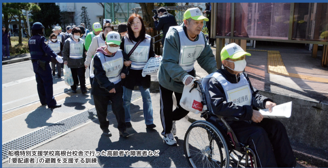
船橋特別支援学校高根台校舎で行った高齢者や障害者など「要配慮者」の避難を支援する訓練

市のデータ 人口 624,473人 (529人増) 世帯 273,901 (1,111増) 男 311,898人 面積 85.62km 2 女 312,575人 (平成28年4月1日現在)※増減は前月比