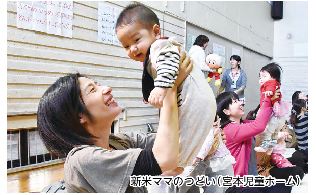
新米ママのつどい(宮本児童ホーム)