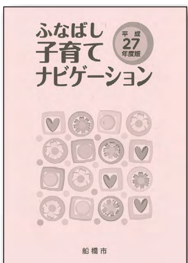
A4サイズ(画像は27年度版)