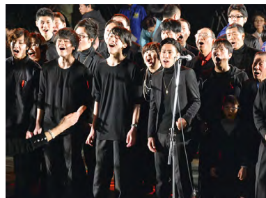
▲公募により結成されたメンバーで歌い上げた見事なゴスペル