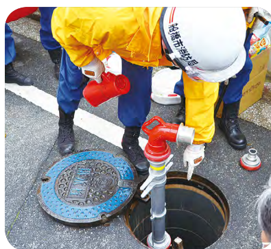
上水道の排水栓に専用の資機材を取り付け、初期消火活動を行うことができます

大雨による浸水対策 都市化に伴う雨水流出の増大に対応するため、船橋特別支援学校高根台校舎の校庭に雨水貯留浸透施設を整備します。また、駒込川を準用河川として整備するための設計等を行います。