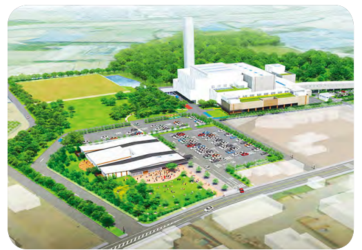
焼却処理で発生する熱を利用した温浴施設を併設する北部清掃工場

市民の憩いの場であり、防災面からも重要な公園の拡充を図るため、5つの公園(大穴近