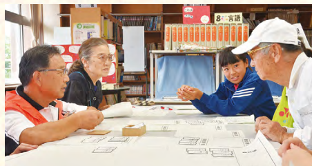
▲中学生を交え、避難所運営ゲーム(HUG)で災害時のとるべき行動を確認(27年の総合防災訓練・御滝中)

※いっせい行動訓練(シェイクアウト訓練)…参加者がそれぞれのいる場所で地震から身を守るための『3つの安全行動(①姿勢を低くし、②体や頭を守り、③揺れが収まるまでじっとする)』を約1分間行う訓練