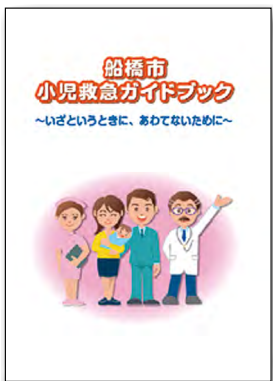
A6サイズ(画像は27年度版)