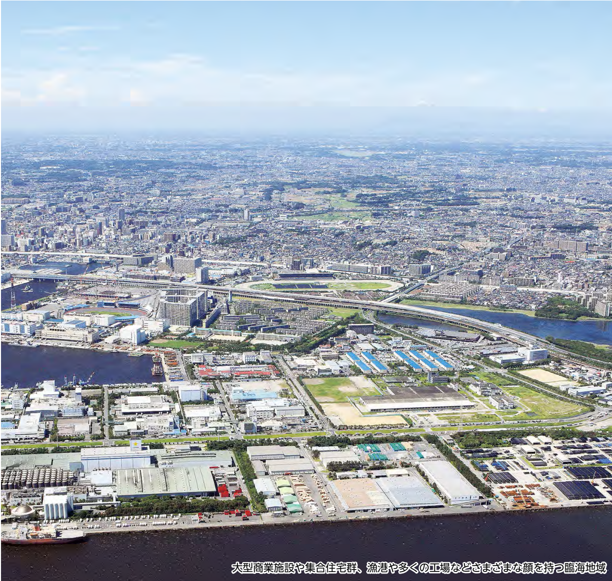
大型商業施設や集合住宅群、漁港や多くの工場などさまざまな顔を持つ臨海地域

人口 623,695人(213人増) 世帯 277,751(172増) 男 312,433人 面積 85.62km 2 女 311,262人 (平成28年2月1日現在)※増減は前月比