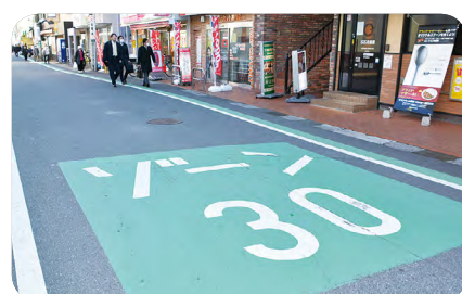
▲自動車の最高速度を時速30キロメートルに設定するなど生活道路の安全を確保する「ゾーン30」

市の中央部に位置し中心市街地に近い等、地理的利点がある海老川上流地区において、自然との調和を図りながら医療・福祉機能を中核とするまちづくりに着手するため、事業計画を検討します。