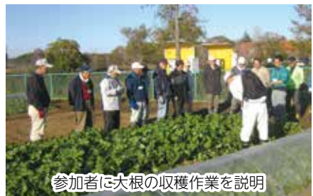
参加者に大根の収穫作業を説明