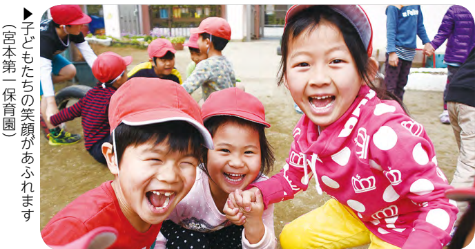
子どもたちの笑顔があふれます(宮本第一保育園)

市が定める一定の基準を満たした認可外保育施設を「認証保育所」として認証し、施設運営費や保育料に対する助成を