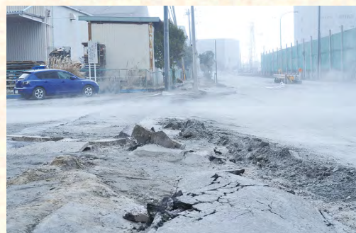
▲液状化の被害を受けた潮見町の道路

首都直下地震はいつ起きてもおかしくないとされています。ぜひ、ご家庭では自宅の耐震補強、家具の転倒防止、非常食・水の備蓄など、また地域では高齢者や障害のある人への避難支援の体制づくりなど、日頃からの備えをできる範囲で進めていただきたいと思います。