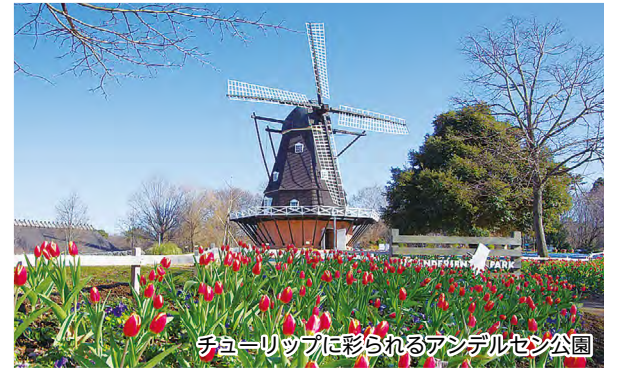
チューリップに彩られるアンデルセン公園