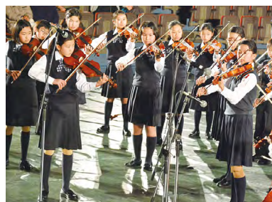
▲全国大会金賞受賞の海神小弦楽部がその実力を披露