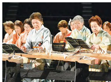
▲気品ある箏の音色が会場を包みま