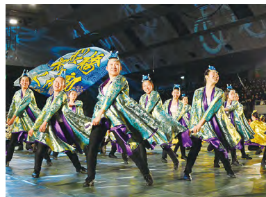
▲市立船橋高校吹奏楽部は迫力あるよさこいで会場を盛り上げました