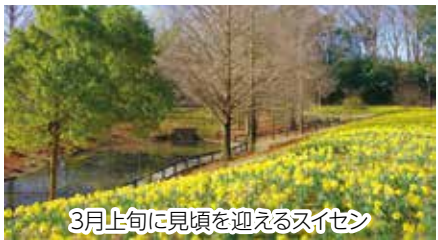
3月上旬に見頃を迎えるスイセン

開園時間 午前9時30分～午後4時 ※3月20日(祝)～4月7日(木)は午後5時まで