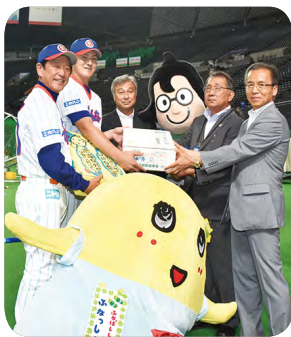
▲27年8月に札幌ドームで「船橋のなし」のトップセールスを行いました

「船橋にんじん」や「船橋のなし」、小松菜、スズキ、海苔、ホシノス貝等の船橋産農水産物の認知度向上を図るため、札幌ドームや東京スカイツリーソラ