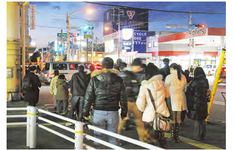
▲3.11に市内でも多くの方が帰宅困難となりました

※毎月1日、15日や防災週間等に体験利用が可能です。いざという時に備え、体験しておきましょう