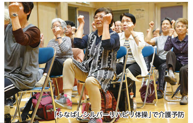
「ふなばしシルバーハピリ体操」で介護予防