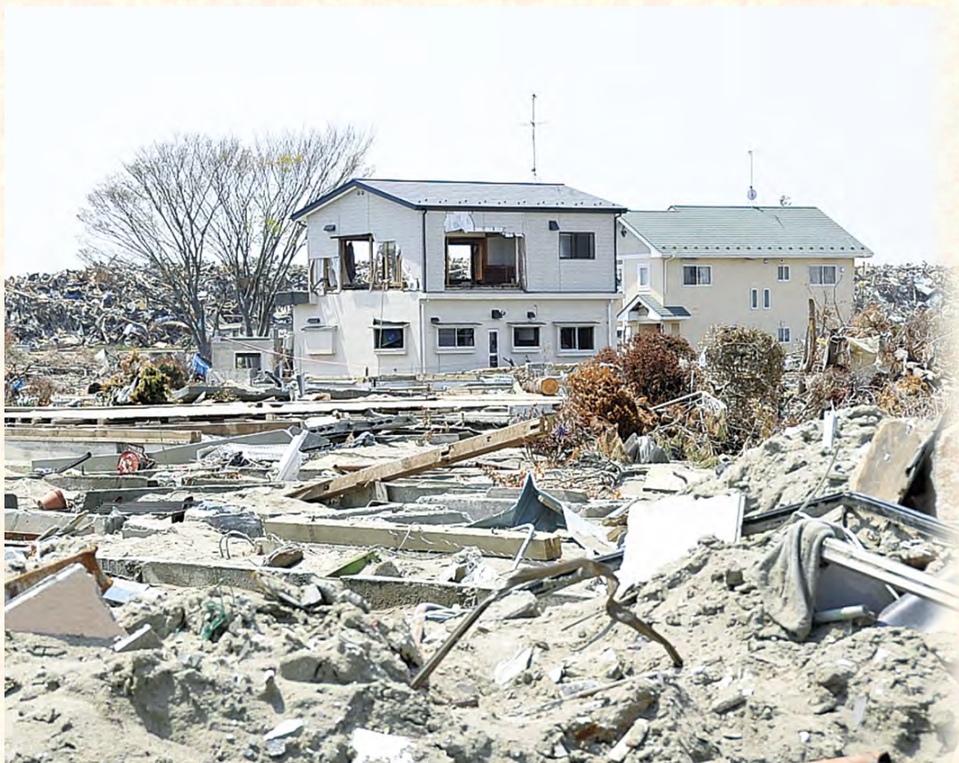
▲津波の被害を受けた石巻市の様子(23年3月18日)