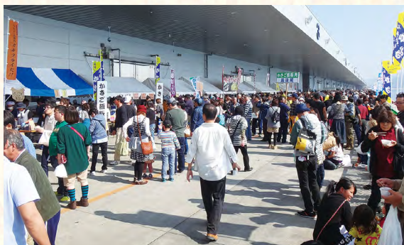
▲4年半ぶりに全面再開した石巻魚市場に人がにぎわう「しのみまき大漁まつり」(27年10月)