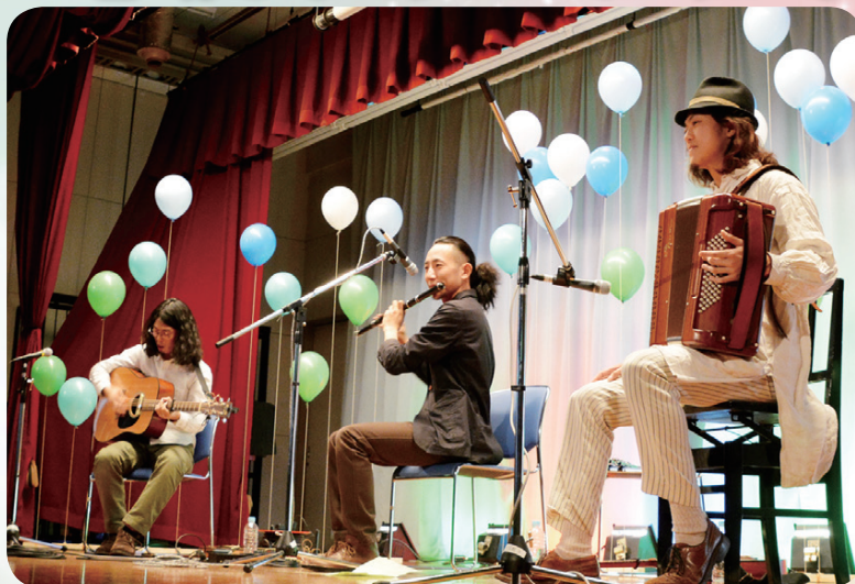
▲各公民館で一流ミュージシャンの演奏を間近で楽しめます▲▶