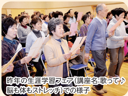
昨年の生涯学習フェア(講座名:歌って♪脳も体もストレッチ)の様子

市民の皆さんが生涯にわたって楽しく学ぶことで、より充実した人生を送ってもらえるよう生涯学習フェアを開催します。ふなばし市民大学校の学生が企画した多彩な6つのプログラムをご用意しました。ぜひ、ご参加ください。