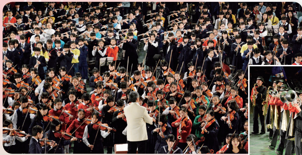
▲▶市民オーケストラ、吹奏楽団、合唱団など総勢2000人を超えるアマチュア音楽家が迫力ある演奏を繰り広げます

2/7(日) 会場の感動をテレビでお届け! 「音楽のまち・ふなばし 千人の音楽祭」