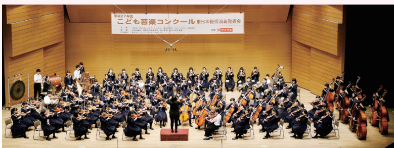
▲息の合った演奏を披露した船橋中学校

船橋では、小・中学校の音楽の部活動がとても盛んで、毎年子どもたちが全国の舞台で活躍しています。12月5日、6日に、習志野文化ホールで開催された「TBS子ども音楽コンクール東日本優秀演奏発表会」で市内4校が最優秀賞に輝きました。このコンクールは、1年かけて、テープ審査、地区大会、ブロック大会、全国大会(ブロック大会で収録したテープによる審査)を行うものです。ブロック大会となる今大会には1都6県から小学校38校、中学校43校が出場。右下表の市内4校が見事、1月24日(日)に行われる全国大会への切符を手に入れました。