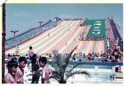
大滝すべり (昭和41年)

しかし、レジャーの多様化による来場者数の減少に加え、地盤沈下防止のために温泉の採掘が禁止されたことから、52年に閉園となりました。