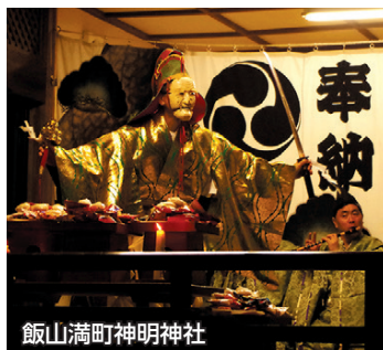
飯山満町神明神社

神楽とは、神に奉納するために行われる舞楽です。市内では五つの神社に神楽が伝承されています。一つのまちにこれだけ多くの神楽が残されているのは大変めずらしく、船橋の大きな特徴といえます。古くは江戸時代から受け継がれてきた地元の伝統を、ぜひご覧ください。