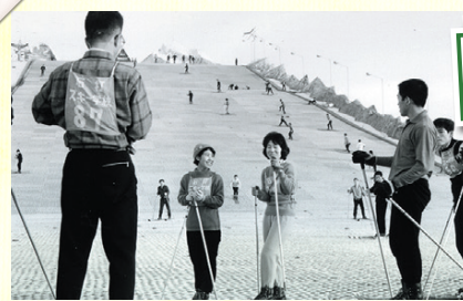
ハイランドスキー場 (昭和39年)

◀ 硬いプラスチックブラシを敷き詰めた人工スキー場として昭和37年に登場。夏でも滑れるスキー場として世間をアツと言わせました