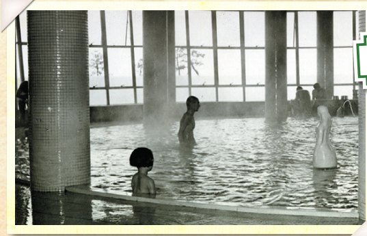
ローマ風呂 (昭和30年)

◀ 広い人工砂浜があり海水浴気分を満喫できました。オープンの年には1日に10万人も訪れた人気施設