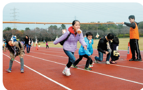
▲パン食い競争など、体を思い切り動かせる催しも盛りだくさん

〈日時〉11月1日(日)午前10時～午後3時 ※当日自由参加。入場無料。雨天の場合、屋外イベントは中止 〈会場〉運動公園 ※来場の際は公共交通機関をご利用ください