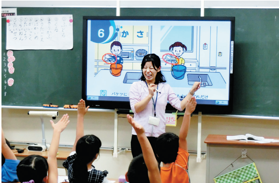
電子黒板を使った授業 (坪井小2年生の教室にて)

市では、子どもたちの情報活用能力の育成や、分かりやすく質の高い授業の実現を目指し、学校教育の現場に「電子黒板」や「タブレット端末」など、ICT(※)を用いた機器の導入を進めています。今年度から坪井小学校・古和釜中学校の2校をモデル校に指定し、授業での活用方法や効果などの検証を始めました。