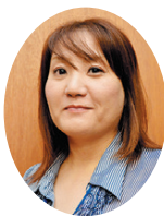
支援員にインタビュー

校内でのICT活用をサポートするICT支援員をモデル校に配置しています。支援員は2校を巡回しデジタル教材等の情報収集や機器の操作・設定など、技術支援と学習支援を行います。 このほか、今年度は別の支援員が53小学校を巡回しデジタル教科書の活用を支援します。