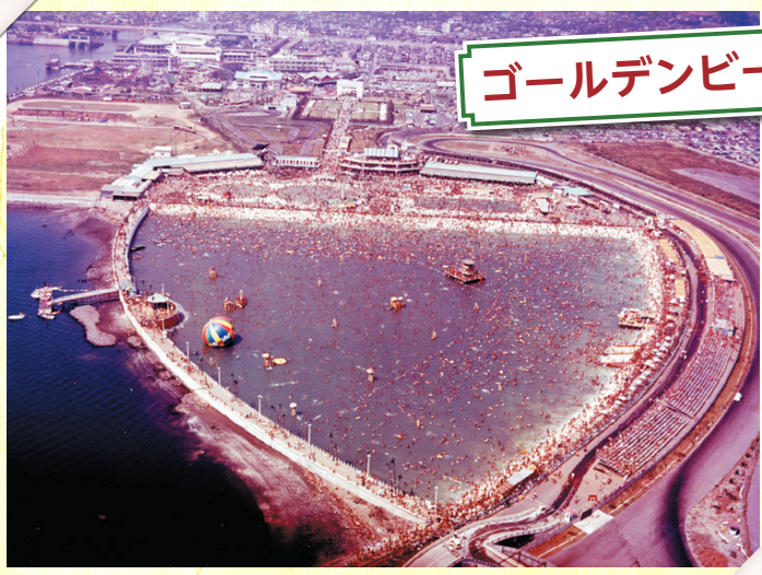
ゴールデンビーチ (昭和43年)

◀ 広い人工砂浜があり海水浴気分を満喫できました。オープンの年には1日に10万人も訪れた人気施設