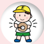
生き生き展キャラクター「キャッチ君」