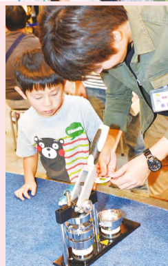
▲オリジナル缶バッジ作りに挑戦