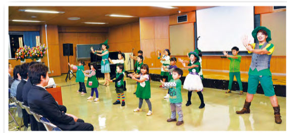
▲3歳~小学3年生で構成された「キッズうぐいす」と一緒に「アブラカタブラ西船なな姫」のダンスを披露

スト達とともに「アブラカタブラ西船なな姫」(西船橋の小松菜マスコットキャラクターのイメージソング)を制作。Akingさんは振り付けを担当した。「聴覚に障害のある人にも曲がイメージできるよう工夫した」という振り付けは、一つひとつの動作にメッセージが込められている。市内のイベントや幼稚園などで踊られ、誰もが親しみやすいと評判だ。「せっかくいただいた賞を無駄にしないよう、これからもっとたくさんの人々にダンスの楽しさを伝えていきたいですね。ダンスで船橋を元気にできれば」と今後の目標を語った。