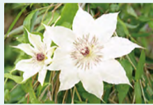
▲市の花「カザグルマ」