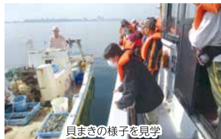
貝まぎの様子を見学

10月25日(日)午前6時15分～正午 ※荒天中止 集合場所 市漁業協同組合事務所(湊町1) 内 アサリ漁とまき網漁の見学ほか 対 市内在住の20歳以上 定 25人(多数は抽選) 申 10月13日(火)必着までに、ハガキ(1枚に2人まで)に「漁業体験」と記入のうえ、住所、氏名、年